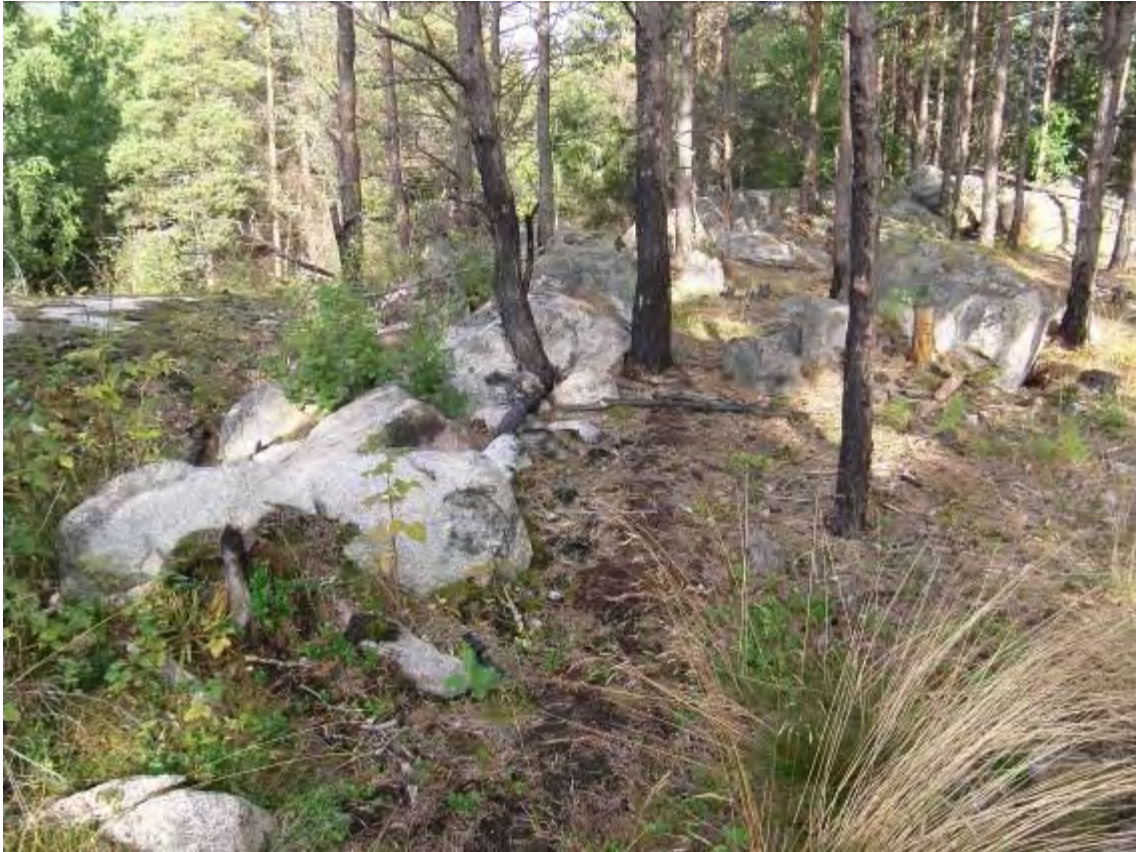
Figur 6. Den södra delen av stenraden nr 238 invid klyftan och den troliga stensättningen nr 239 (i bildens högra kant).

Nedan görs en sammanställning i tabellform av samtliga objekt som återfunnits inom utredningsområdet (jfr fig 3).