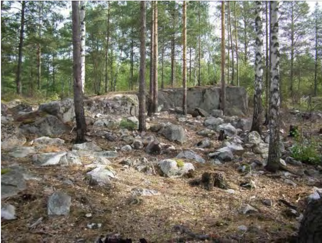
Figur 5. Foto på den stensträngsliknande lämningen nr 237 intill en klippskreva.

Utöver de redan kända fornlämningarna har ytterligare två lokaler med lämningar påträffats. I områdets nordvästra del lokaliserades en stensträngsliknande lämning i kanten av en större bergsskreva (med arbetsnummer 1 på fig 3). Troligen rör det sig om en stensättning men i så fall med ett ovanligt läge. Anläggningen syntes som en stenrad på en "hylla" invid bergsskrevan. Stenraden som var delvis dubbel i den södra kanten, omgärdade ett ca 10 x 7 m stort område. Stenarna i stenraden var 0,5-1,0 m stora (fig 5). Anläggningen har erhållit nr 237 i FMIS.