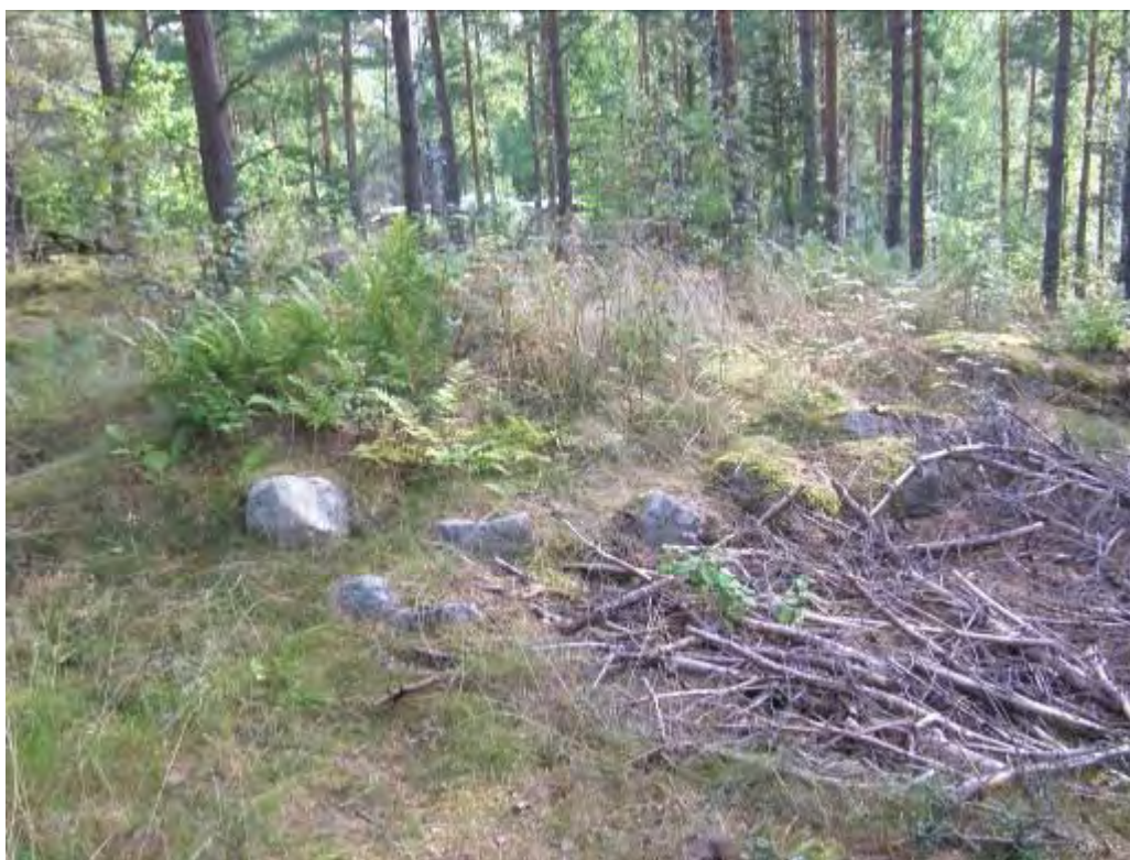
Figur 4. Foto på stensättningen nr 181. Stensättningen som har en kantkedja mot SO-V, ansluter mot en låg bergsrygg i Ö. Vyn mot Skofjärden döljs i dagsläget av granskog.