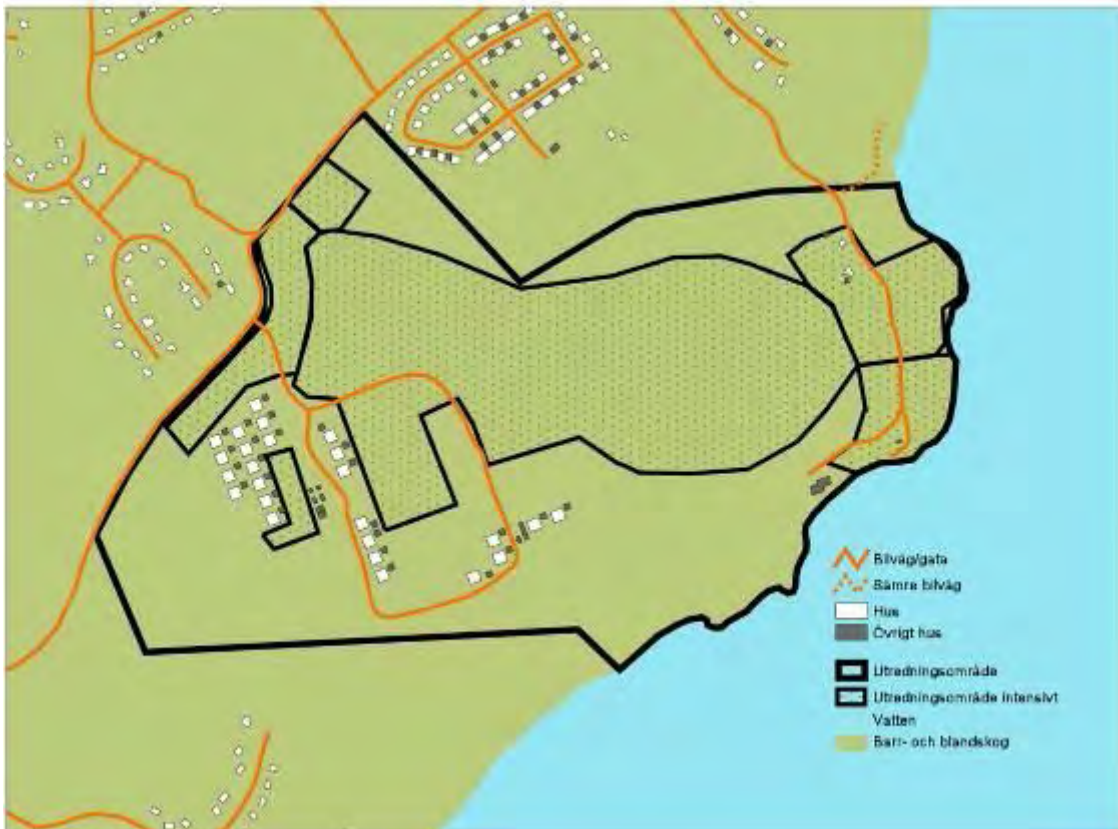
Figur 2. Översiktsbild över utredningsområdet. De rasterade ytorna utgör ungefärlig utbredning av de prioriterade ytorna för bebyggelse, skola och marina. Övrig mark planeras för naturområden. Den markerade bebyggelsen har under senare år ytterligare utökats.

Det fanns tre tidigare kända fornlämningslokaler inom utredningsområdet (fig 3). Nr 173 ligger delvis inom det prioriterade planområdet i dess nordvästra del. De synliga lämningarna består av husgrunder, varav minst två har grunder eller golv av cement. Lämningarna tillhör därför torpets yngsta bebyggelse. I samband med utredningen gjordes en lägesbestämning av de husgrunder som kunde lokaliseras (nr 5-10 på fig 3).