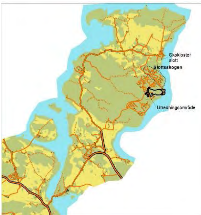
Figur 1. Skohalvön med utredningsområdet markerat

På kartor som stod till förfogande inför utredningen framgick att detaljplanen för Skokloster Sjöstad omfattar ett område av ca 73 ha. Inför utredningen påpekade också uppdragsgivaren att det i första hand var de områden som ska bebyggas som behövde utredas. Det finns tidigare bebyggelse inom området och vissa ytor, som översiktligt framgår av detaljplanen, avses lämnas som naturmark. Sammantaget skulle byggnation av bostäder, skola, marina och övrig verksamhet uppskattningsvis uppta en yta mindre än 50 ha.