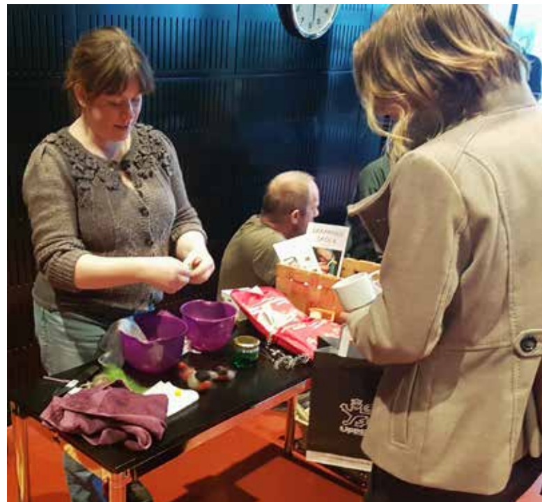
Utbudsdag Slöjd med Grävling's naturprodukter.

LHK ingår i nätverket Kulturkraft med kulturkonsulenter i region Uppsala. Kulturkraft träffas regelbundet, samarbetar och utbyter erfarenheter kring aktuella projekt och aktiviteter riktade till barn och unga.