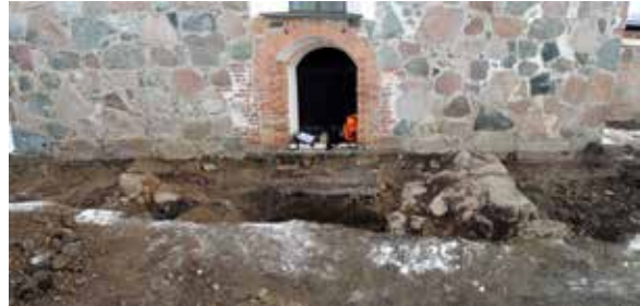
Panorama av den västra gaveln vid Jumkils kyrka där murar efter ett västtorn påträffades under mark.

Upplandsmuseets arkeologer var under året med vid markerbeten vid Jumkils, Lena och Skälftham-