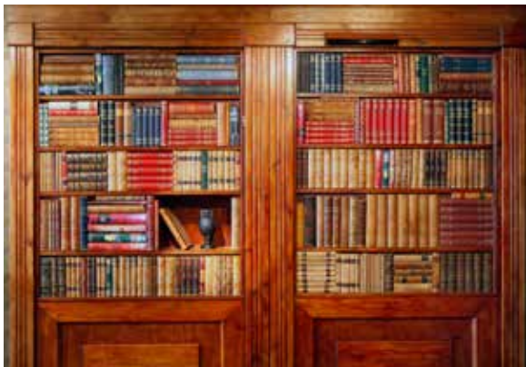
Ovan: Utställningen Sim Sala Bims hemliga ingång.