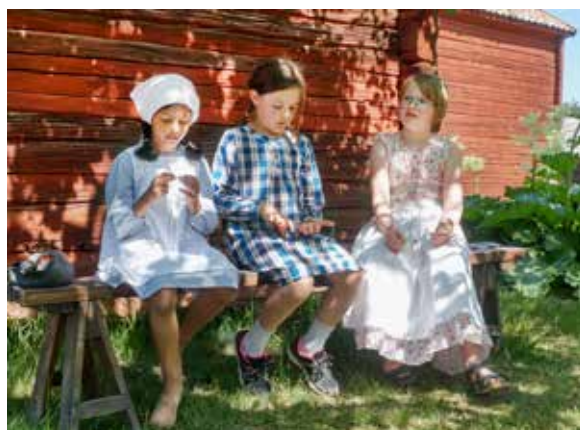
Elever från Ekuddenskolan sitter och slöjdar en Tillsammans-krona. Hela skolan besökte Disagården under en dag och deltog i olika aktiviteter.