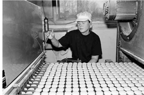
Kvinna vid produktionsband med "Äkta finskorpor" hos Pricks Bagerier AB i Tierp. Bilden togs i samband med företagets flytt till Malmköping vid årsskiftet 2004–2005.