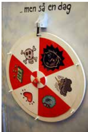
Detalj ur berättarskåpet.