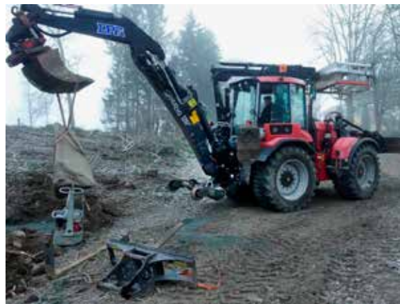
Runsten U1033 vid Årby utanför Storvreta ställs tillbaka på ett nytt fundament.

Avdelning Arkeologi har under 2018 även utfört ett antal kulturmiljövårdande uppdrag. Det har rört sig om restaurering av en skadad grav, en inventering av ett gravfält som kommit till skada vid hyggesplöjning samt flytt respektive grundförstärkning av två runstenar som riskerade att välta.