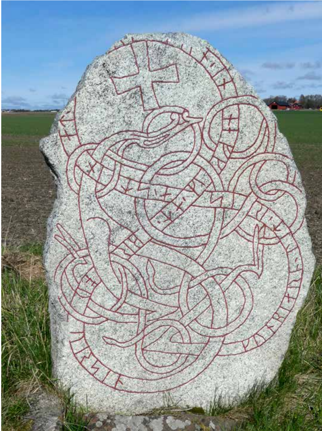
Runsten U950 vid Myrby i östra Uppsala är en av årets inventerade runstenar i Uppsala län.