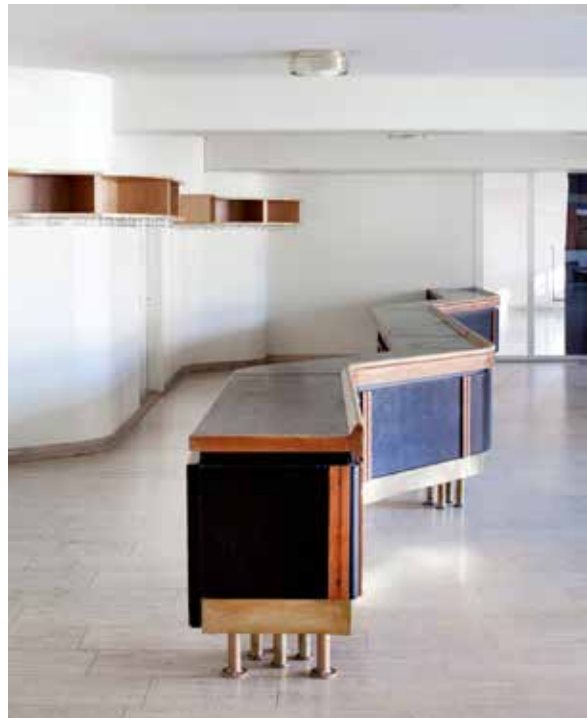
Den svängda, organiska formen är ett av Aaltos arkitektoniska kännetecken. Garderobdisk ritad av Aalto i V-Dalas foajé.