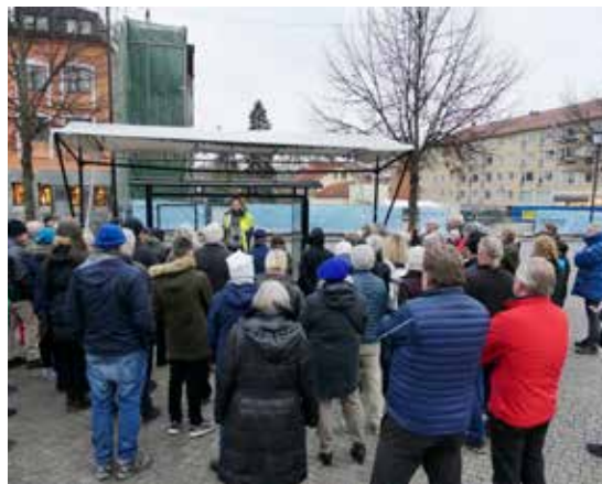
Årets öppna visningar av den arkeologiska undersökningen i Enköping lockade många besökare.