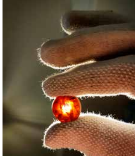
Pärla i bärnsten hittad i kvarteret Traktören i Enköping.

Exploateringstrycket i länet speglades i den arkeologiska uppdragsverksamheten genom ett flertal arkeologiska utredningar och förundersökningar i Uppsalas omnejd.