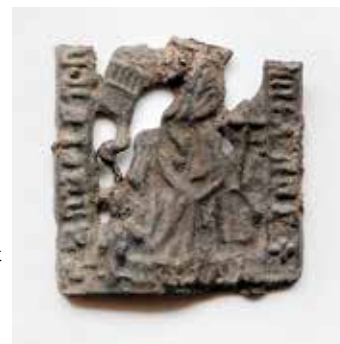
T.h.: Ett pilgrimsärke från Vadstena – ett så kallat Birgittamärke som hittades vid undersökningen i Enköping.