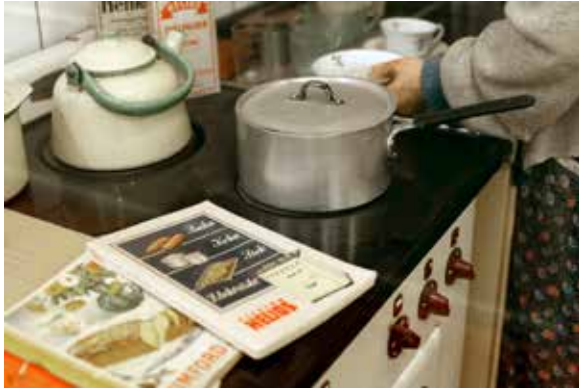
Ovan: Folkhemsköket ur utställningen Vårt Uppsala. Foto Olle Norling.

T.h.: Tiden i rummet. Foto Olle Norling.