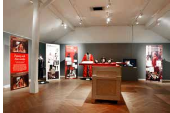
T.h.: Utställningen Fanny och Alexander | Bergman Moods.