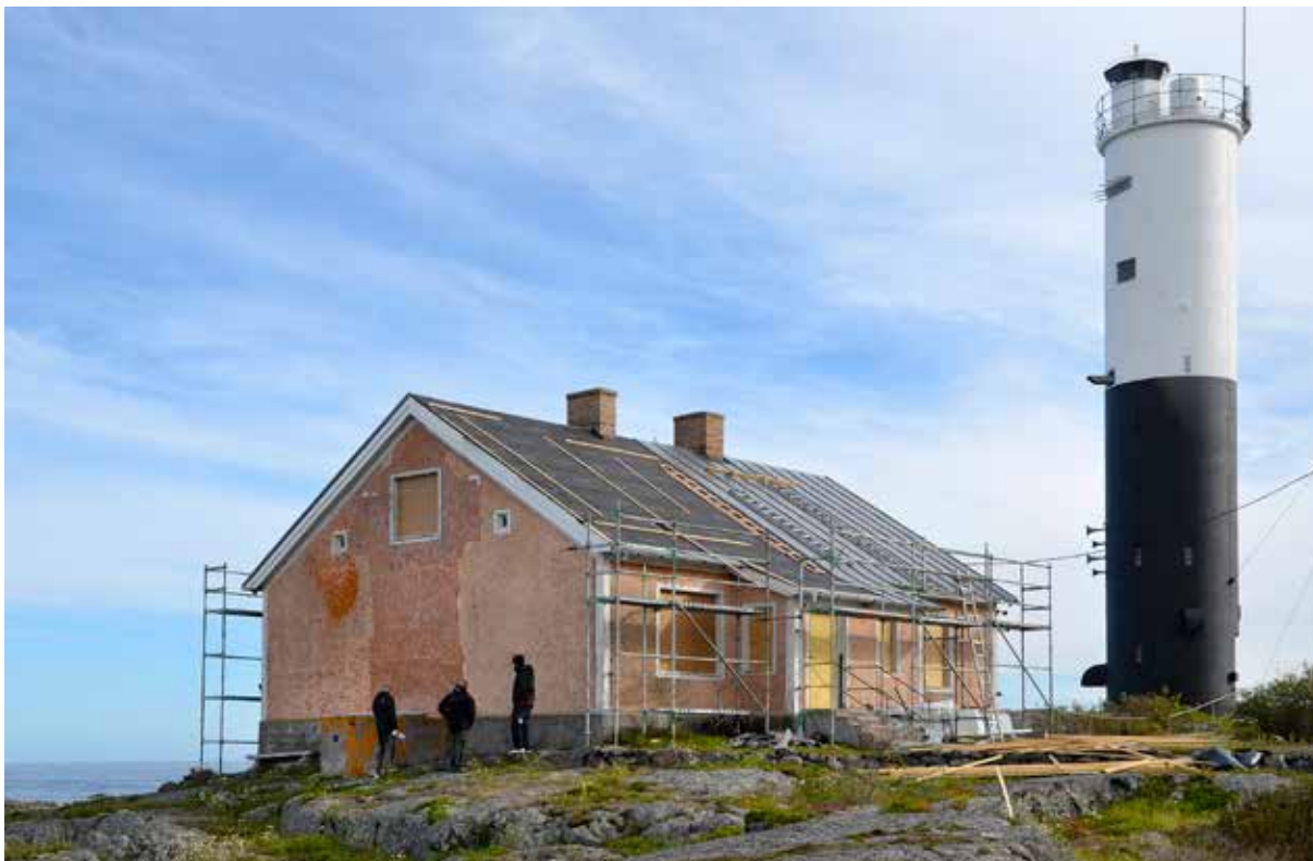
Upplandsmuseet medverkade som antikvarisk expert då Upplandsstiftelsen låtit rusta fyrvaktarbostaden på Björns fyrplats, anlagd 1859 utanför Hållnäs-kusten.

har pekats ut har varit Länna gård i Almunge och Kvallsta i Östuna. I ett objekt med mindre skala men med samma syfte har Upplandsmuseet inför ombyggnaden av Petterslunds förskola i Uppsala genomfört en sk antikvarisk förundersökning. Att bibehålla de arkitekturhistoriska värdena har varit en målsättning samtidigt som byggnaden ska kunna användas på ett ändamålsenligt sätt.