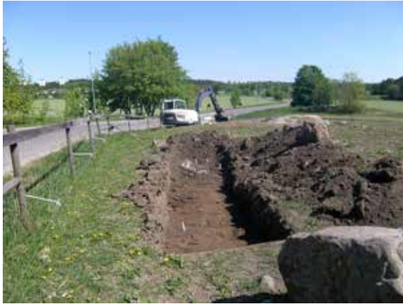
I schakt vid Håga gård fanns härdar och andra lämningar av äldre boplatser.