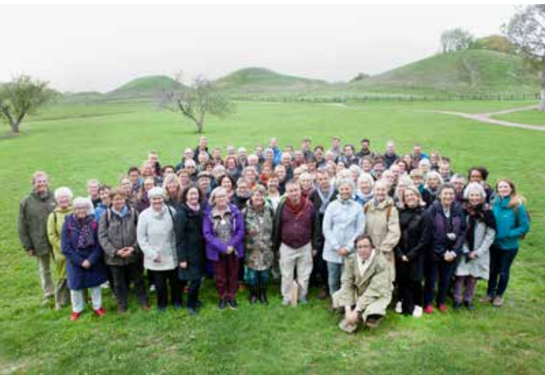
Det 69e internationella Sachsensymposiet besöker Gamla Uppsala.