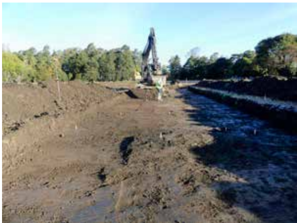
Arkeologisk förundersökning i Fyrislund med undersökning av härdar och stolphål från järnålder.

eller järnålder. De är exponerade mot Hågaån och visar att förhistoriska lämningar inte enbart finns kring Hågahögen.