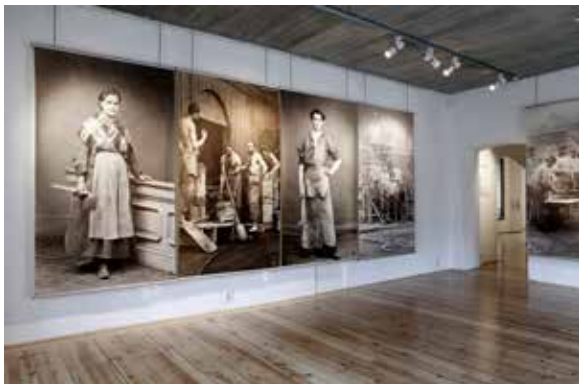
Ovan: Fotoutställningen Vallonien.