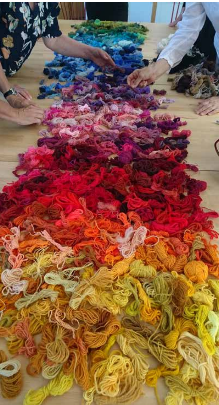
Ullmarknaden och färgworkshop med Tant Kofta.