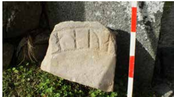
Fragment av en runsten, som ovanligt nog är gjord av kalksten, hittades under hösten då en del av muren runt Lena kyrkogård lades om. Troligen rör det sig om en del av samma runsten som finns uppställd inne kyrkan, med nummer U1028.

ars kyrkor. Vid Jumkils och Lena kyrkor gjordes undersökningar både i kyrkorna och runt dessa. Vid Jumkils kyrka påträffades bl.a. resterna efter ett påbörjat men inte slutfört bygge av ett västtorn.