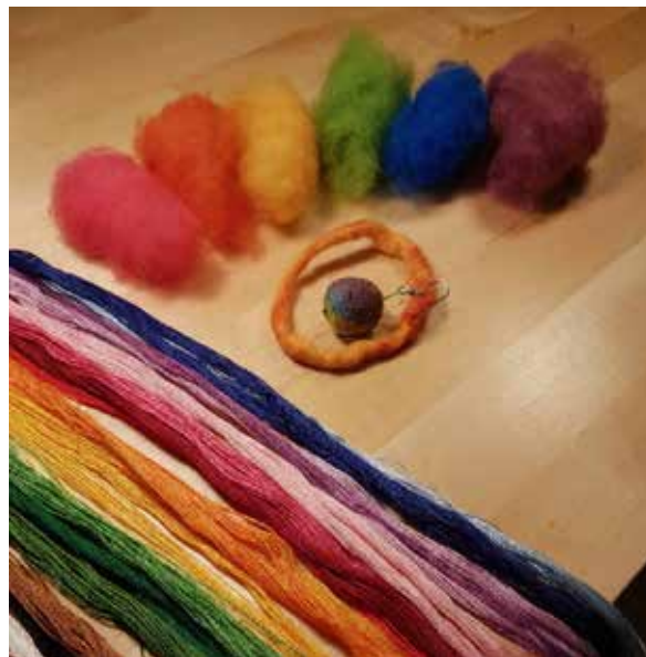
Slöjd i regnbågens färger på Café Colorful.

För tredje året i rad har årskurs 3 på Lilla Valsäteraskolan haft ett skapande skola-projekt som handlat om forntiden. De har tagit del av programmet Vad berättar vikingarnas runstenar? och gått på en forntidsexkursion kring skolans närområde. Elever i årskurserna 2–5 på Gamla Uppsala skola har besökt Disagården under våren 2018. Eftersom de under hösten 2017 hade besökt Walmstedtska gården fick de en jämförelse mellan sociala grupper i olika geografiska miljöer. Ekuddenskolans besökte Disagården under en heldag. Eleverna i årskurserna