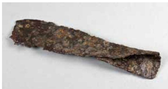
UM43393, ämnesjärn påträffat i Valö socken.

Förvärvskommitténs bedömning grundar sig på Upplandsmuseets profilmråden Jordbruk, Järnhantering och Makt. Till detta läggs ytterligare insamlingskriterier, bland annat genus, mångfald, generation, representativitet, kontext och tid. Under 2018 sammanträdde förvärvskommittén två gånger. Anledningen till det låga antalet möten beror dels på att gåvoförfrågningarna var få och i vissa fall av en karaktär där grundläggande kriterier, till exempel kopplingen till vår region eller något av våra övriga insamlingskriterier, ej varit tydliga. I