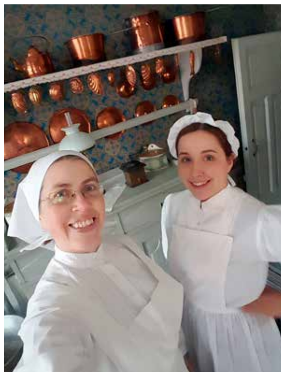
Lovlediga barn fick möta husan Lovisa och köksan Gustava i professorhemmet på Walmstedtska gården.

Den 23 maj genomfördes en utbildningsdag för Disagårdens stugvärdar och för medlemmarna i Gamla Upsala hembygdsförening och Kulturföreningen Fyrisgillet. Dagen innehöll en kulturhistorisk fördjupning, samtal om normkritik och värds-kap, samt rutiner kring brand och säkerhet.