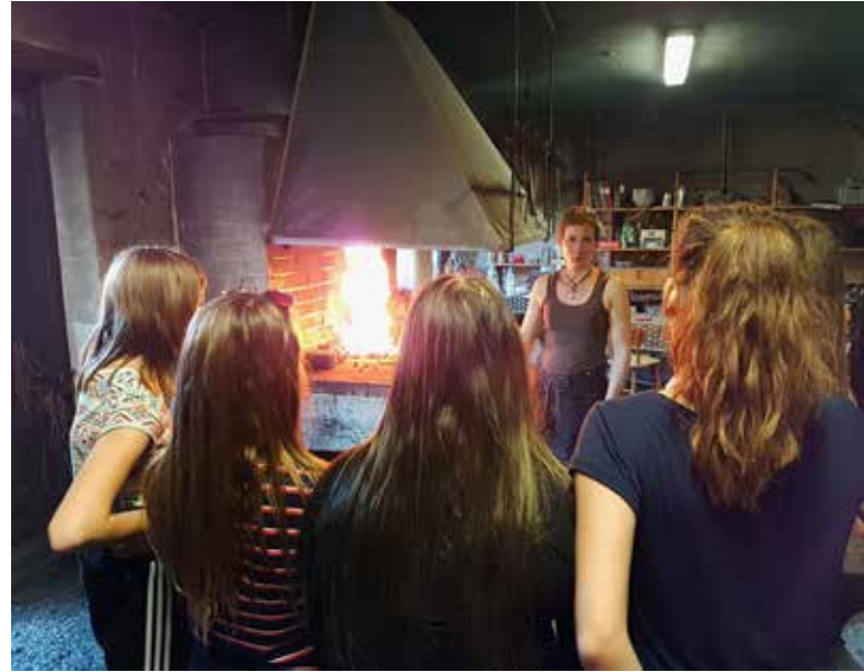
Ovan: En dag på bruket.