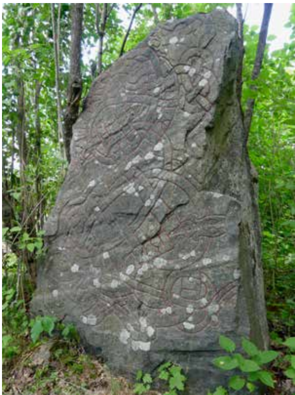
På årets runstensinventering besöktes bland annat runsten U750 vid Viggeby, Enköpings kommun. Stenen är mycket vacker, men är på väg att skymmas av en berså.

ristningar ska under en tvåårsperiod besiktigas. Under året besöktes ungefär hälften av runristningarna, där uppgifter om deras skick, skyltning, läge, tillgänglighet för besökare, skymmande vegetation m.m. registrerades. Dessutom gjordes grundlig fotodokumentation av varje runsten. Många stenar fotodokumenterades även med teknik som resulterat i publicerade 3D-bilder på internet. Resultaten av inventeringen kommer att ligga till grund för ett framtida vårdprogram. En utställning om runstenar baserad på inventeringsresultatet planeras till hösten 2020.