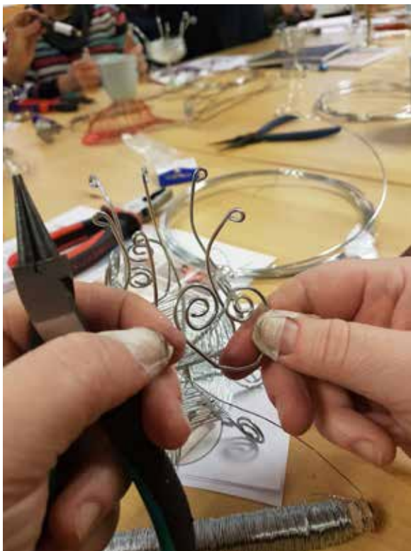
Lovslöjd – luffarslöjd.