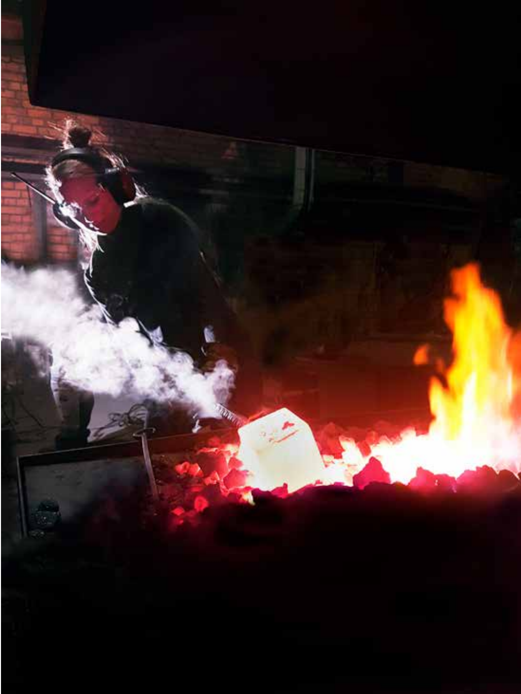
7 kg järn.