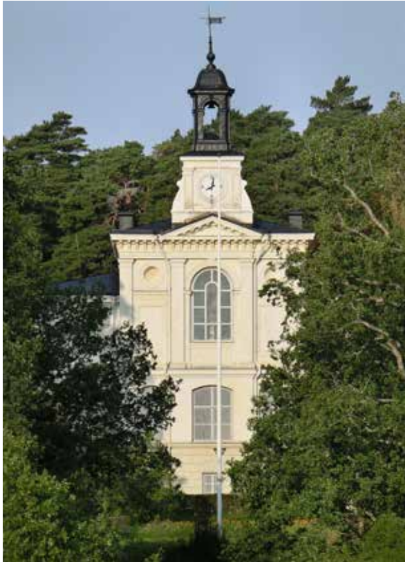
I mitten av Vingmuttern ligger det vackra centralpartiet i nyklassicism. Bakom den anslående fasaden med det stora fönstret ligger sjukhuskyrkan Den gode herdens kapell. Andlig spis för patienter och personal var ett lagkrav när byggnaden uppfördes på 1880-talet.

storskalig stålproducent. Det är en viktig årsring i kulturmiljön i Österbybruk. Museet har nu fördjupat historiken och kunskapen om ugnarna och dess industriella kontext och utfört en ingående kulturhistorisk värdering.