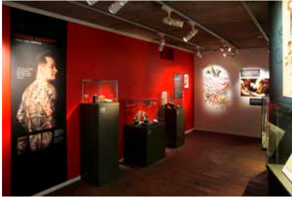
Utställningen Tro, hopp och kärlek, om sjömanstatueringar.