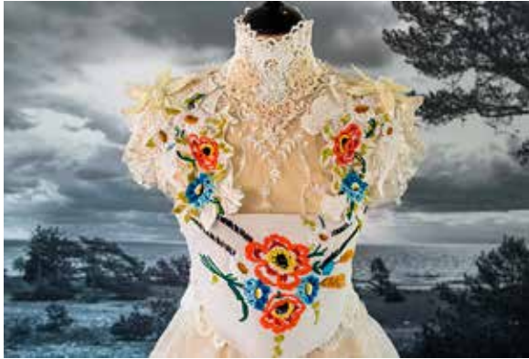
T.v.: Från utställningen Fanny och Alexander | Bergman Moods.