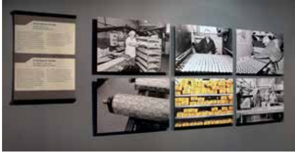
Ovan: Från utställningen Samtiden i fokus.