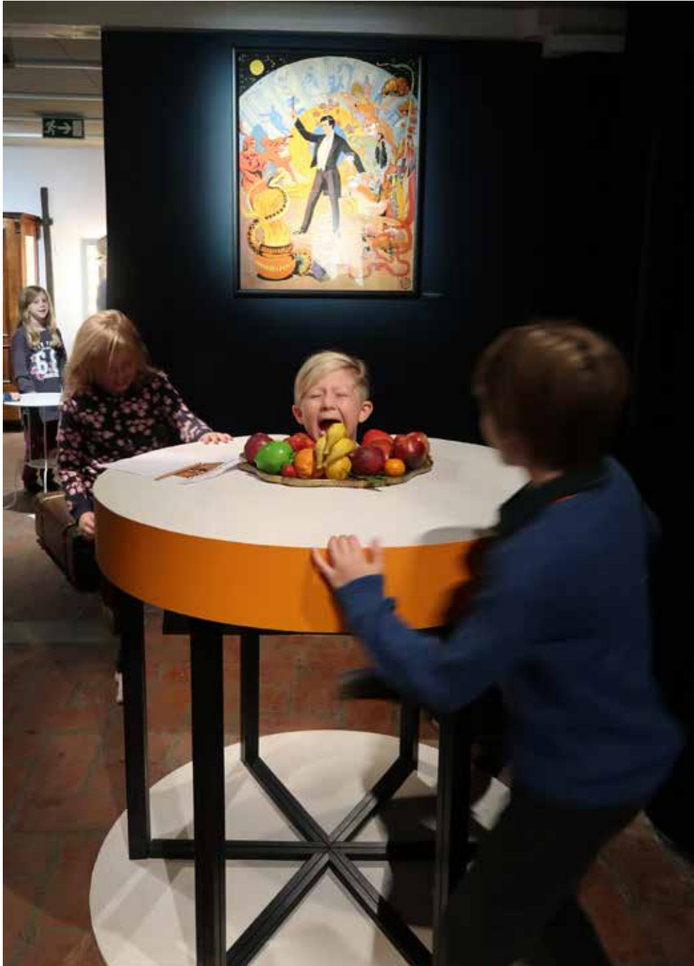
Utställningen Sim Sala Bim lockade både till skratt och reflektion för eleverna som tog del av skolprogrammet.