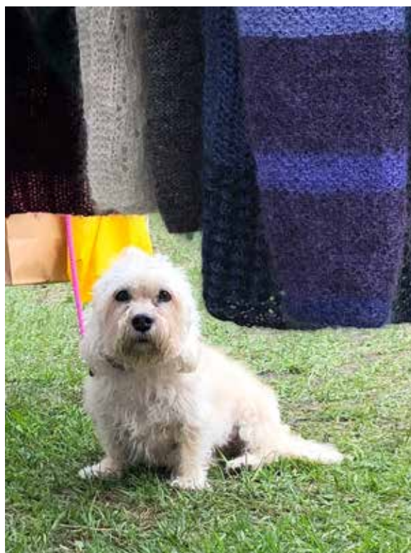
"Ulligt" på ullmarknaden.