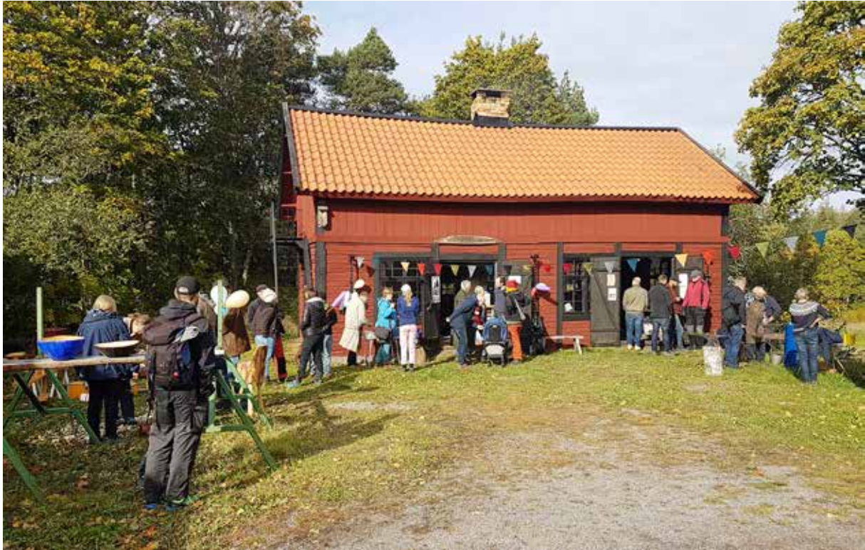
Invigning Hammarskogssmedjan.