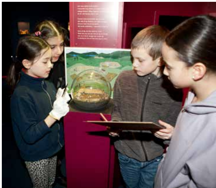
I skolprogrammet Forntiden under dina fötter får eleverna undersöka forntiden med hjälp av arkeologiska fynd och utställningen Tiden i rummet.