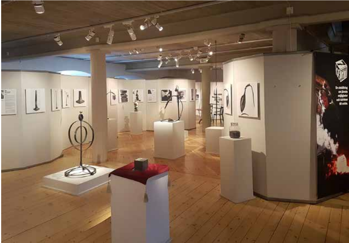
Utställningsvy från 7 kg järn.

järnsmidesprojektet – Gränslöst smide. Projektet är ett samarbetsprojekt mellan Hemslöjdskonsulenterna i region Uppsala, Dalarna samt Gävleborg.