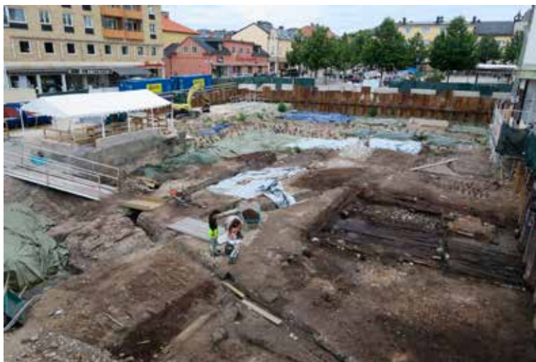
Pågående dokumentation av en tomt från 1500-talet vid den stora stadsundersökningen i Enköping. Till höger i bild syns resterna av ett hus med trägolv och ett spisfundament i tegel.