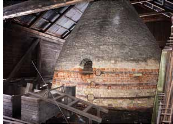
I brännstålsugnen på bilden förädlades vallonstångjärn till stål kring sekelskiftet 1900, i en hantverksmässig produktion som hade varit densamma i över hundra år. Det var i liknande brännstålsugnar i Sheffield som det exporterade vallonstångjärnet hamnade. Produktionen blev aldrig speciellt omfattande, men den ledde vidare till en mer industriell och storskalig stålproduktion vid Österbybruk. Man skulle kunna säga att ugnen blev startpunkten för den industriella revolutionen vid bruket.

En annan miljö som Upplandsmuseet tagit fram kunskapsunderlag för är Kartans möbelsnickeri i Östervåla. Kartans snickeri, uppfört 1917, var när det upphörde 1997 det sista i bruk av de en gång så många möbelsnickerierna runt om i Östervåla. Snickeriet är bevarat med fast inredning och samtliga inventarier i det skick som det var när den siste snickaren lämnade verkstaden. Snickeriet representerar den betydande och lokala näring som möbelsnickeri och stolsnickeri utgjorde i Östervåla från tidigt 1800-tal.