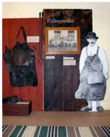
Utställningen På järnets tid, visas på Leufsta Bruksarkiv.