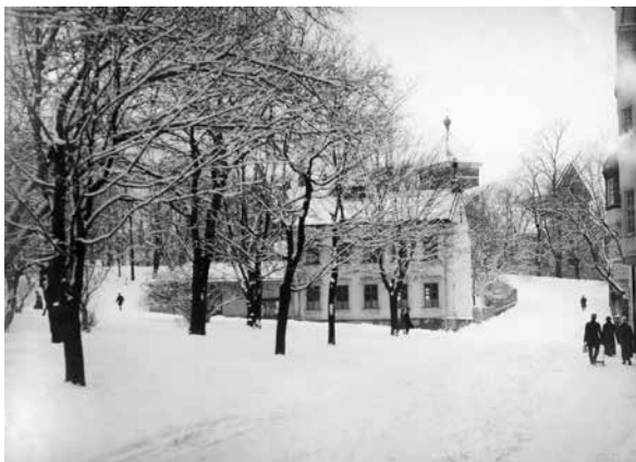
Vy Nedre Slottsgatan/Drottninggatan upp mot Odinslund och Helga Trefaldighetskyrkan, Uppsala, sekelskiftet 1900. Okänd fotograf.