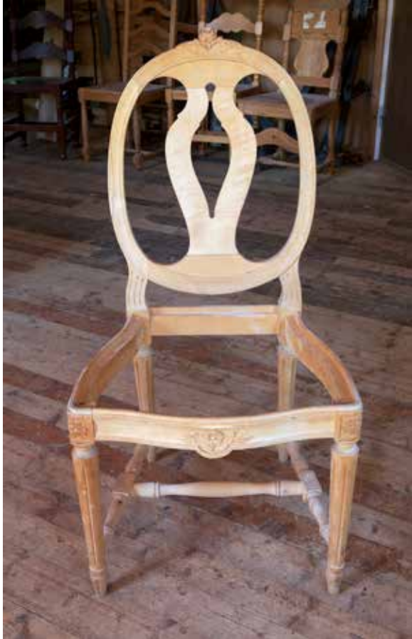
Kartans möbelsnickeri tillverkade framför allt stilmöbler, som den populära "rosenstolen".

gamla masugnsbyggnaden vid Tobo bruk eldhärjades under sommaren. Mitt under semestertider i juli fick Upplandsmuseet åka ut och dokumentera och värdera det som fanns kvar i förödelsen. Museet kunde konstatera att mycket hade förstörts, men också att anläggningen fortfarande besitter stora kulturhistoriska värden.