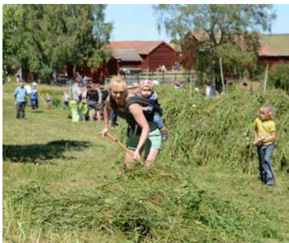
Årets slåtter lockade många besökare. Stora som små hjälpte till att slå, kratta och hässja.