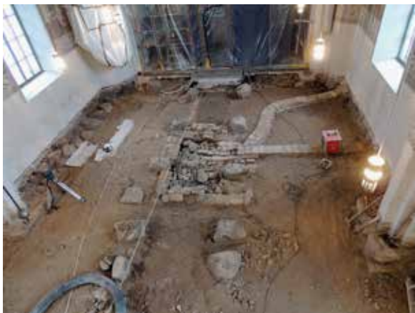
På bilden, som är tagen från Lena kyrkas orgelläktare, syns den murade gravkammaren i mitten av långhuset. Från gravkammaren löper en ventilationskanal, troligen från början av 1900-talet. Till vänster i bilden framskymtar den grundmur som eventuellt kan vara äldre än den nuvarande kyrkan, uppförd omkring år 1300.