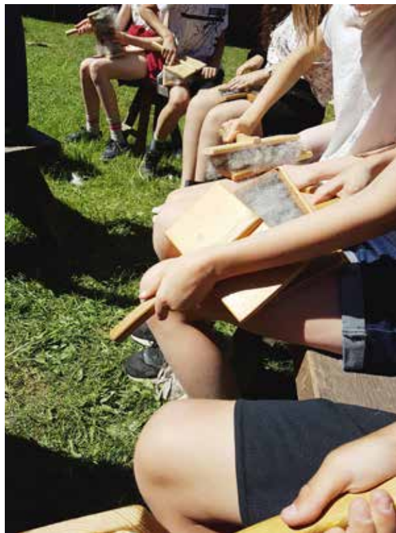
Ull på Disagården.

Med stöd från Tierp kommun arrangerade vi under juni ett sommarläger i kulturskolans lokaler. 15 barn deltog under lägrets fyra dagar. Projektet utfördes tillsammans med två externa slöjdhandledare.