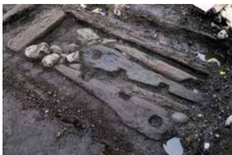
T.v.: Flera återanvända båtdeklar hittades vid undersökningen i Enköping. Här syns två spelbetingar som tidigare suttit på en medeltida kogg.