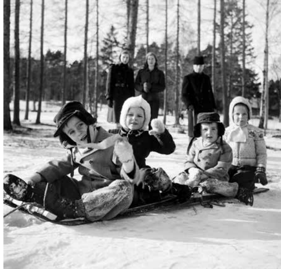
Skidans dag, Uppsala, februari 1948.

Under 2018 fortsatte arbetet med att vårda, registrera och fotografera Upplandsmuseets föremålssamlingar. Nya och gamla föremålsposter kompletterades med nytagna färgfotografier samt information. Under året lades en mycket omfat-