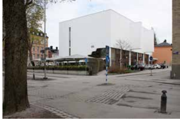
V-Dala nationshus är en unik och särpräglad byggnad i Uppsala, ritad av den världsberömda finske arkitekten Alvar Aalto. Från väster syns den tidigare öppningen i byggnaden som syftade till att öka det infallande solljuset till den ursprungliga nationsgården under huset.

Museets arbete med länets kyrkogårdar har fortsatt under året, med kulturhistorisk klassificering av gravplatser på Gamla Uppsala respektive Vaksala kyrkogård. Klassificeringen är en grund för ett bevarandearbete av gravplatserna, som berättar om kyrkogårdens, socknens och de begravda människornas historia.