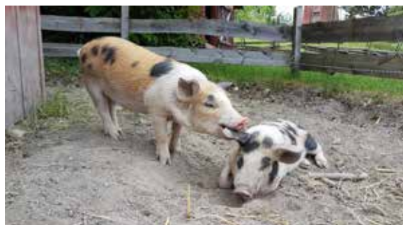
Hasse och Tage var två riktigt busiga Linderösvin som charmade alla som besökte Disagården.