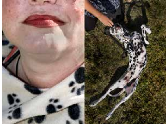
Utställningen 500 - 5mph.