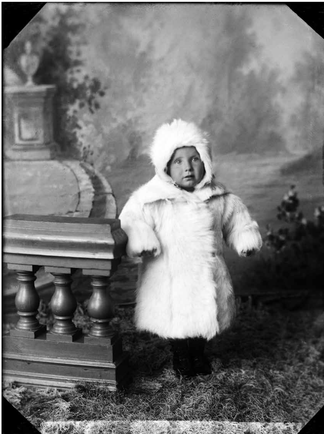
Barnporträtt, Östhammar, Uppland.