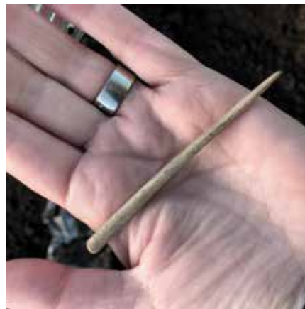
En vacker polerad bensyl från bronsålder påträffad i ett avfalls lager vid Håggeby.

Väster om Björklinge har vi under 2017 och 2018 gjort flera arkeologiska insatser i samband med nedläggning av en högspänningskabel. Vid Håggeby gick schaktsträckan nära ett järnåldersgravfält och rakt igenom en mycket stor bronsåldersboplats som vi delundersökte under hösten. Själva undersökningsområdet var smalt, endast 2 m, men sträckte sig längs hela boplatsens längd, närmare 200 meter. Inom området undersöktes ett antal förhistoriska avfalls lager som var upp till en halv meter tjocka och innehöll stora mängd djurben, keramik och bränd lera, men framför allt kol, sot och skörbränd sten från härdar och kokgropar. Här undersöktes också stolphål, kokgropar och ett möjligt grophus. Utifrån på fyndmaterialet kan boplatsen troligen dateras till yngre bronsålder, alltså cirka 1000–500 f.Kr.