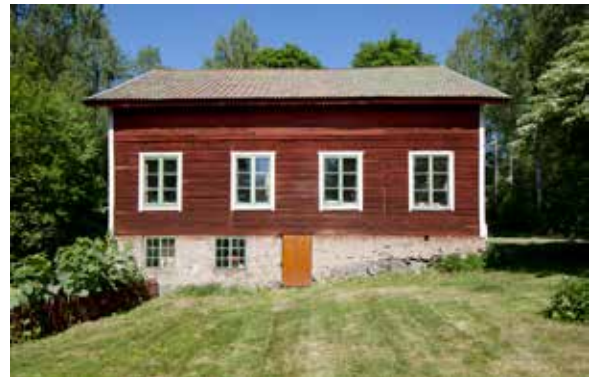
Kartans snickeribyggnad från 1917 är bevarad som när den siste snickaren lämnade verkstaden 1997.

En helt annan typ av kulturmiljö som museet sammanställt kunskapsunderlag för är Västmanland-Dalas nationshus i Uppsala. V-Dala, som uppfördes 1965, är ett av Uppsalas främsta och finaste exempel på modernistisk arkitektur och ritat av den världsberömda arkitekten Alvar Aalto. Vidare har Upplandsmuseet sammanställt en kunskapsöversikt över länets samtliga 69 byggnadsminnen.