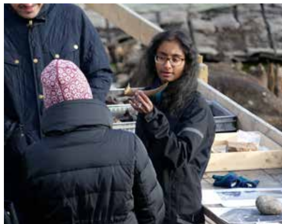
Att få gissa på olika föremål som arkeologerna grävt upp var väldigt uppskattat av eleverna på SFI i Enköping.

Under hösten har museipedagog Frida Gereonsson vid två tillfällen besökt Enköpings språkcafé som drivs av biblioteket och där nysvenskar och etablerade svenskar kan umgås och fika. Genom