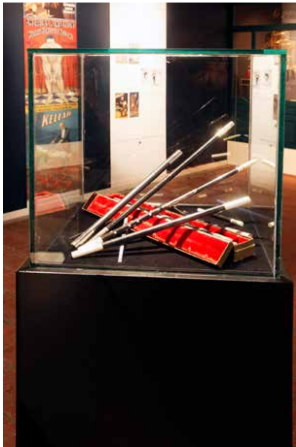
T.h.: Utställningen Sim Sala Bims trollstavar.

eleverna på ett undersökande och roligt sätt lära sig mer om magi och vetenskap och hur människor uppfattar världen. Utifrån ett vetenskapligt förhållningssätt har eleverna fått se, granska och prova trollkonstnärernas trick. Visningar och program har även bokats av gymnasiet och vuxengrupper. Allmänna visningar, familjevisningar och pedagogisk skaparverkstad kopplat till utställningen har erbjudits.