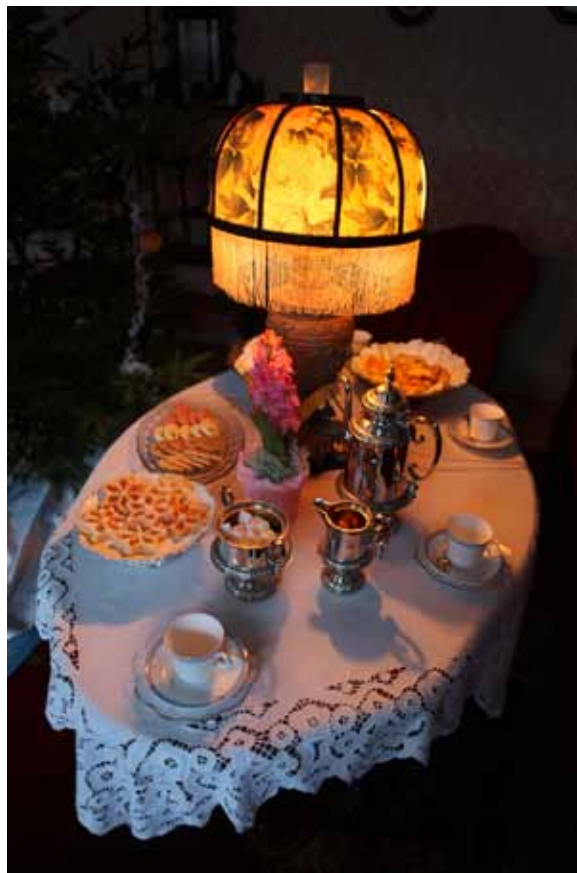
Julaftons kaffebord är dukat. Walmstedtska gården.

Sportlovet och kulturlovet bjöd på öppen verkstad och visningar med olika teman. Under påsklovet var verkstaden öppen under några dagar och då, liksom på kulturlovet kunde barn och vuxna tillsam-