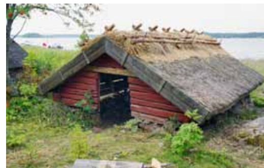
T.v.: Restaurerad smedja i Ryssbol, Rasbo socken.

Mitten: F.d. brygghus och tvättstuga i Hemringe uppförd i lera. Lerhuset uppfördes under 1800-talets första del. På 1780-talet introducerades en virkesbesparande byggnadsteknik, uppförandet av byggnader med stomme av packad lera. Genom propagandaskrifter försökte bönder förmås att uppföra lerhus. Lerhuset i Hemringe utgör ett av de få kvarvarande lerhus av de som uppfördes på bondgårdar inom Uppsala län.