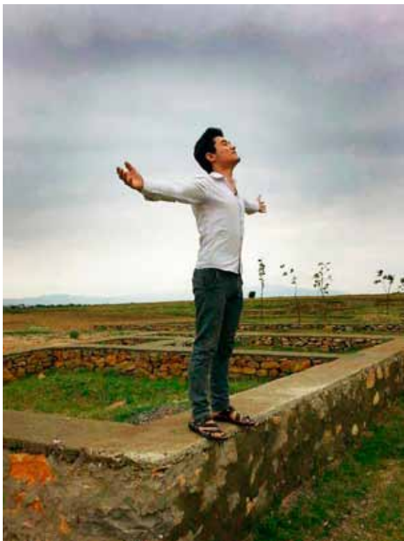
Från utställningen I telefonen finns hela människan.

luft och havsbad. Ett flärdfullt nöjesliv långt från vardagens bekymmer, under en epok som varade åren 1880–1930. Sedan tog nya tider vid. Sommartid bestående av badgäster och bofasta.