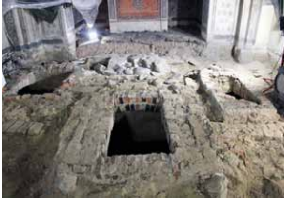
Under golvet i Alsike kyrkas kor undersöktes tre gravkammare i slutet av året.