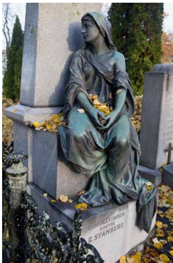
Sorgen. Uppsala gamla kyrkogård.

Upplandsmuseet, kulturmiljö, har sedan 2013 genomfört ett antal inventeringar av länets kyrkogårdar på uppdrag av Svenska kyrkan. Detta kunskapsmaterial blev upprinnelsen till utställningen Minns att jag levat. Syftet med utställningen är inte att beskriva inventeringarnas resultat, utan mer sätta fo-