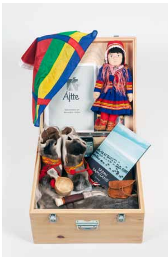
Samelådan från Åjtte fjäll- och samemuseum.

Upplandsmuseets del bestod framförallt i framtagandet och genomförandet av stadsvandringarna, med förarbete under våren och genomförande under hösten. Genom fotografier, citat ur böcker och intervjuer samt inslag av ljudkonst av kompositören Lisa Stenberg har turen runt Uppsala lyft fram berättelser och personer, en ti-