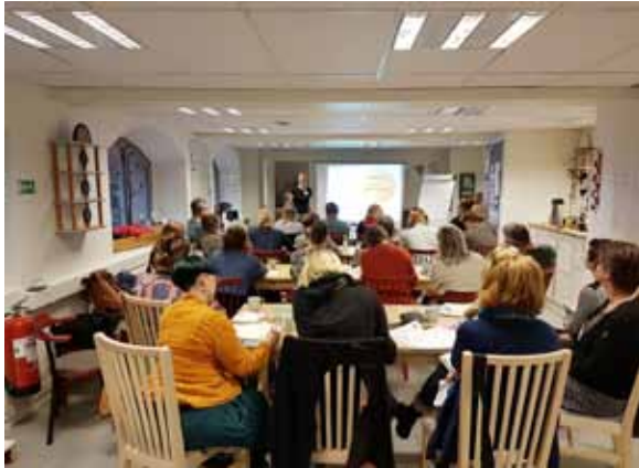
Gott om plats i nya lokalen. Fortbildningsdag för kollegor med fokus på barn och unga.

arrangerades under tre dagar i Uppsala med LHK som värd i Kaniken. Konferensen berörde främst det nya handledarmaterialet och den kursplan som är framtagen till den. Intensiva dagar med föreläsningar, workshops och slöjdande. Det var totalt 30 konsulenter som deltog från hela landet.