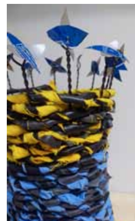
T.v.: Himmeli – populär kurs med kursledare Eija Koski, Finland.