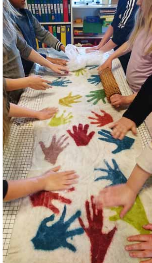
Tovning med förskolebarn på Mehede skola.

Fyrisgården har under året fortsatt med sin slöjdverksamhet för barn, som går under namnet ”trägnagarna”. Eleverna får här prova flera olika slöjdtekniker under ledning av Kajsa Sjöln som är utbildad Slöjdklubbshandledare. Det har under året varit totalt 36 tillfällen med 17 barn.