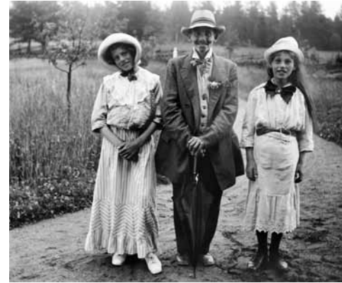
T.v.: Ruben Liljefors med sin dotter Marit ute i trädgården, sannolikt på sommarstället Svensgården, Dalarna.