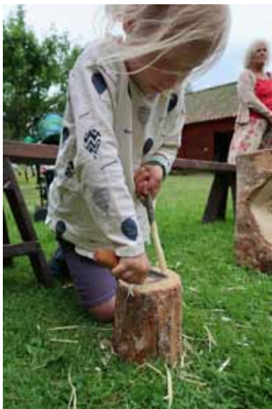
Leka för att lära. Ett bildcollage som visar sommarens aktiviteter på Disagården inleder kapitlet Årsredovisning.

stadshuset. Totalt har 1719 besökare tagit del av de öppna visningarna.