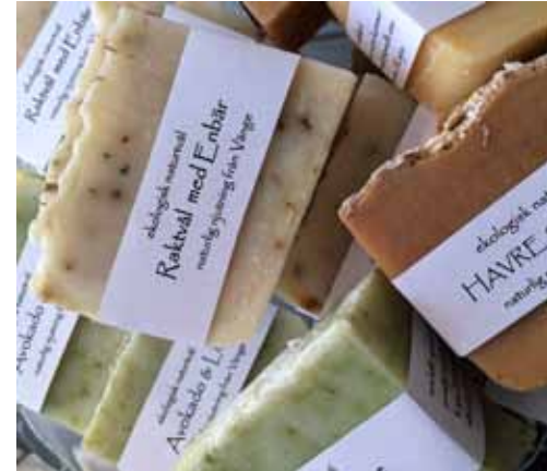
Ett urval av produkterna i museishopen.

i låg- och mellanstadiet samt särskolan tagit del av programmet.