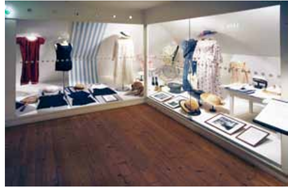
Baddräkter typiska för sekelskiftet 1900.

allmänna grupper. Pressarbete samt digital kommunikation via museets egna kanaler på hemsidan, facebook, instagram och arkeologernas blogg. På plats sattes vepor samt ett informations/skyltskåp upp runt utgrävningsplatsen.