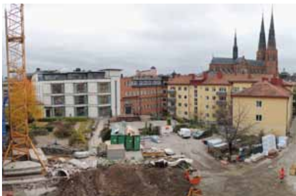
Ovan t.v.: Panorama över Uppsala med den arkeologiska undersökningen vid det medeltida franciskankonventet närmast i bild.

Sammanställning av antalet utförda arkeologiska uppdrag under 2017. Gällande schaktningsövervakningar gjordes dessa oftast i form av arkeologiska förundersökningar.