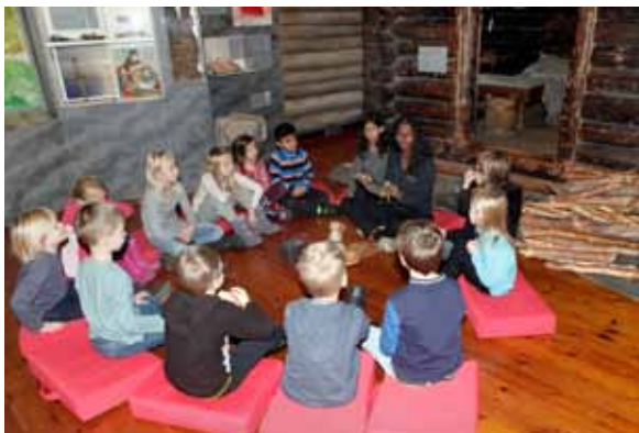
Många skolklasser besöker utställningen Vårt Uppsala.