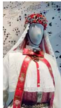
T.v.: Ordlös slöjd. Kultur på recept - projekt i Gottsunda.