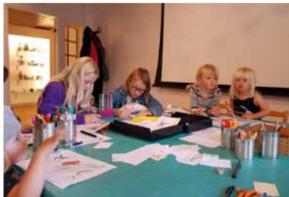
Skaparverkstad till utställningen Tro, hopp och kärlek.

var på ett sådant besök. Vidare kan också nämnas besök av medlemmar ur Länsforskningsrådet, PRO Sala samt Kultur och Fritidsnämnden i Norrtälje kommun. Utöver detta har enskilda forskarbesök ägt rum.