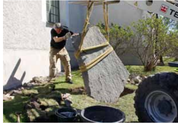
Den runsten (U874) som hittades vid Hagby kyrka 2016 ställdes varsamt upp på sin nya plats invid kyrkan under försommaren 2017.

söktes endast den yta av tomten vilken ligger närmast Westerlundiska gården. Inom denna undersökningsyta fanns flera hus, varav merparten nyttjade som fåhus och stenlagda ytor från 1400–1600-talet. Under tjocka lager av påförd dynga grävdes i botten av schaktet en gata fram. Denna har löpt parallellt med den medeltida strandlinjen och kan preliminärt dateras till 1300-tal.