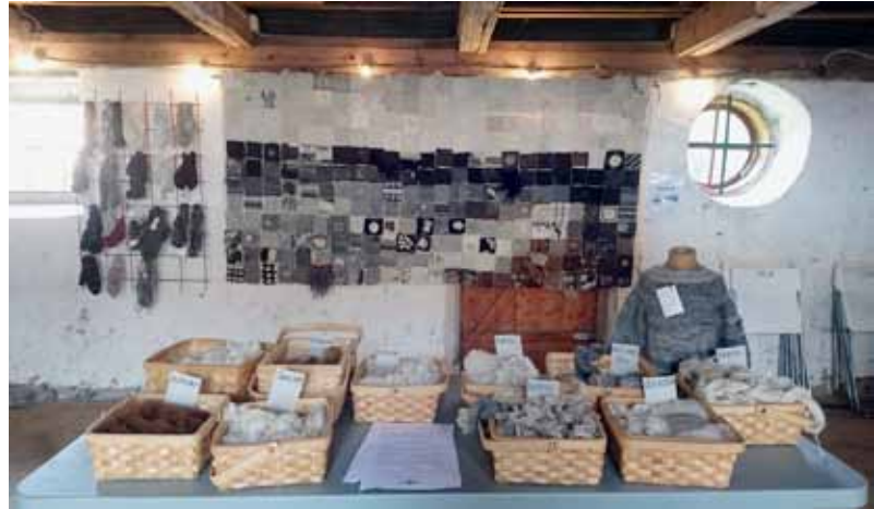
T.v.: Del av utställningen Ull för livet.