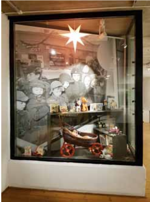
T.v.: Julskyltning i en av de nya hörnmontrarna på museets hörsal. T.h.:Pepparkaksfabriken Pricks i Tierp.