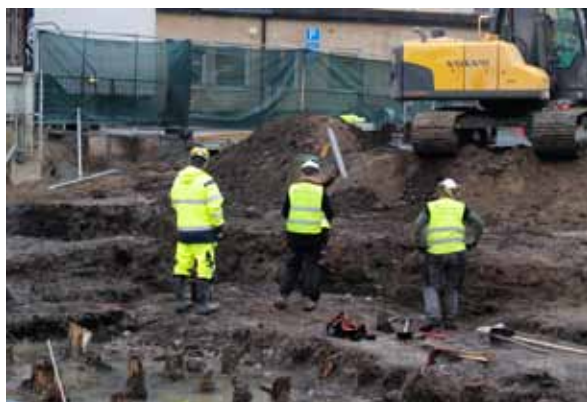
Ovan t.v.: Medeltida kulturlager friläggs på Stadshotellets gamla tomt invid Stora Torget i Enköping. Här ska ca 500 m 3 kulturlager med lämningar från 1800–1100-tal undersökas fram till hösten 2018.