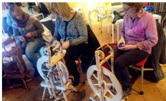
Spinträffar – ett bra tillfälle att lära av varandra.

Att samlas runt ett gemensamt, specifikt intresse och dela kunskap och inspiration med varandra, att träffas i ”riktiga livet”, inte bara på nätet, lockar allt