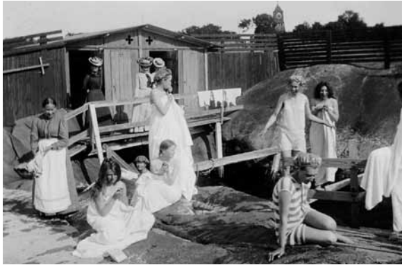
Badande damer vid damernas kallbadhus i Öregrund, omkring 1900. En miljö dit män inte hade tillträde.