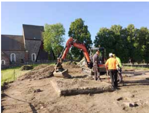
Årets arkeologiska forskningsundersökning på södra Kungsgårdsplatån i Gamla Uppsala där en monumental hallbyggnad undersöktes.