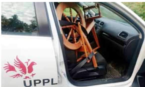
På väg mot nya uppdrag i länet.

marknaden. Även biblioteken och föreningar runt om i länet efterfrågar slöjdverksamhet i allt större utsträckning. I de flesta fall anlitar vi slöjdhandledare som anställs av bibliotek eller studieförbund. Dessa tillfällen, som alltid är kostnadsfria, lockar till görande och väcker nyfikenhet på ett mer krävligt sätt, ofta som en ingång till längre kurser. Synlighet ute på olika platser i länet är en viktig del av vår verksamhet. Under året har drygt 50 tillfällen lockat 1096 personer till slöjd på olika sätt – täljning, tovning, origami, himmeli och spinning för att nämna några. För verksamhet på bibliotek och föreningsgårdar lånar vi ut verktyg och stöttar med material i den mån det är möjligt. De olika slöjdföreningarna hyr in sig i lokalerna för att erbjuda verksamhet till medlemmarna, som t.ex. föreningen Upplandslin.