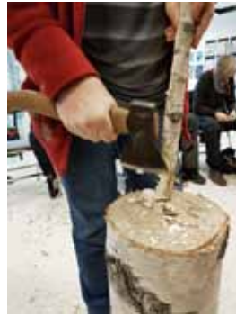
T.h.: Workshop täjning på Håbo bibliotek.

shops i syfte att stärka kunskap om ull och dess användbarhet. Se mer under rubriken Hemslöjd som näringsgren.