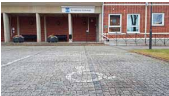
Projektet (O)Möjligheternas landsbygd påbörjade intervjuer i Älvkarleby kommun. Av intresse är både hur individen upplever sin vardagsmiljö och hur kommunen planerar med ett funktionshinderperspektiv.

dels "Hushållens finansiella dispositioner i det förindustriella Norden" vid Uppsala universitet.