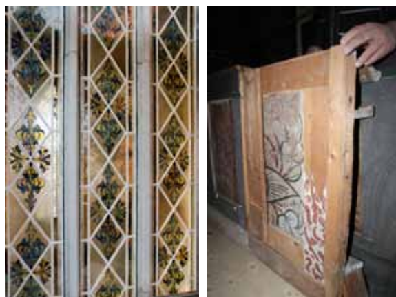
T.v.: Vasakoret i domkyrkan har fem fönster med bemålat glas som alla har genomgått ett varsamt underhållsarbete sedan installationen på 1970-talet. Sist ut var ett av fönstren mot norr. Glasen i de tre lansetterna har motiv med franska liljor och är infattade i ramar av rostfritt stål.

Bland övriga kyrkoantikvariska uppdrag kan nämnas antikvarisk medverkan vid installation av ljushållare, Ärentuna kyrka (Uppsala kommun), komplettering av tak- och markavvattning, Lena kyrka (Uppsala kommun), omtjarning av tak, Tegelmora kyrka (Tierps kommun), omläggningar av kyrkogårdsmurar, Tolfta kyrka (Tierps kommun), reparation av taklag intill tornet, Hållnäs kyrka (Tierps kommun), ny orgel i Almtunakyrkan (Uppsala kommun), omputsning och avfärgning av takfotslist, Tuna kyrka (Uppsala kommun), invändig ombyggnad av Alunda kyrka, (Östhammars kommun), rengöring och konservering av inventarier