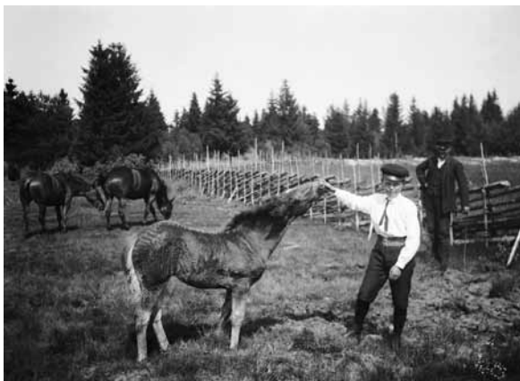
Pojke klappar föl i hästhage, Östhammar, Uppland.