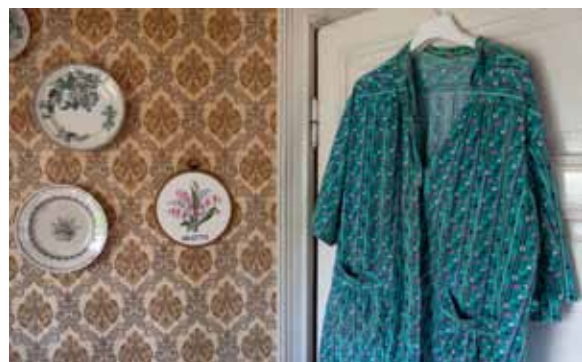
Överst t.h.: Gruvbyggare i gruvstugan strax innan de tog hissen ner i gruvan. Bilden togs i samband med Upplandsmuseets samtidsundersökning av Dannemora gruvor 1991–92. Digitaliseringen av bilderna från undersökningen har pågått under 2017.