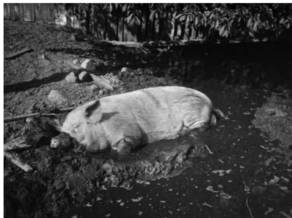
Gris ligger i lerpöl, Östhammar, Uppland.

kulturhistoriskt värde har prioriterats samt äldre samlingar där negativerna är i sämre skick. Det finns även tidiga digitaliseringsarbeten som inte motsvarar de höga krav som vi ställer idag, vilket har resulterat i en del omskanningar för att bevara bilderna för all framtid.