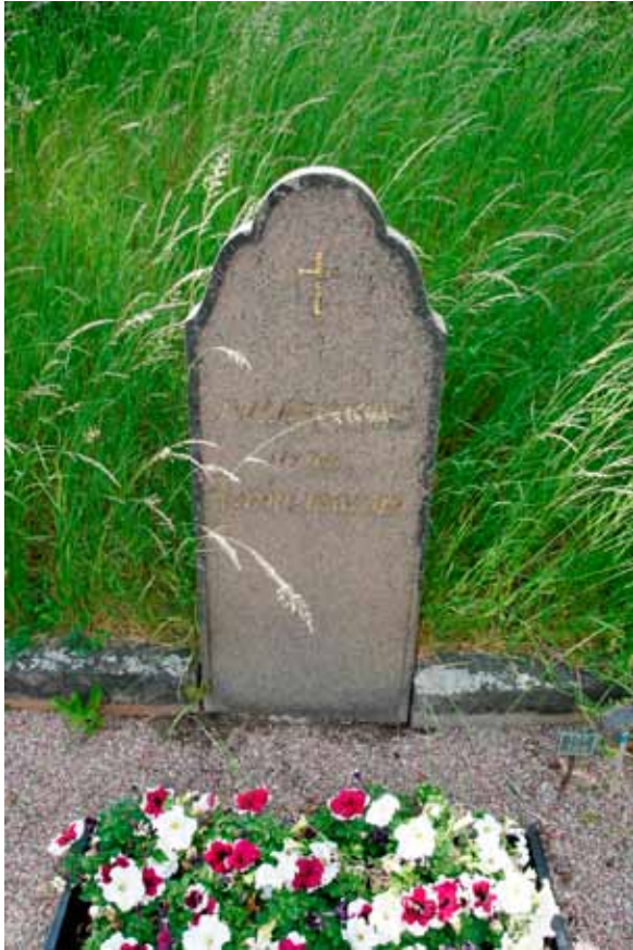
Gravvård från 1920-talet i röd, polerad granit, Danmarks kyrkogård.

den. Här utförde Upplandsmuseets arkeologer både utredningar, förundersökningar och en undersökning inom olika ytor. Vid Häggeby undersöktes en intensivt nyttjad boplatz från järnålder med spår efter hus. I Kvarnbolund, inne på Ragn-Sells avfallsstation, undersöktes en grav och en skärvstenshöj som låg oroväckande nära containrar och skräphögar. Graven som daterats till förromersk järnålder innehöll brända ben från en människa samt en stor mängd bränd lera från en ugsanläggning. Graven och skärvstenshögen vittnar om att hur platsen utnyttjats för ca 2000 år sedan.