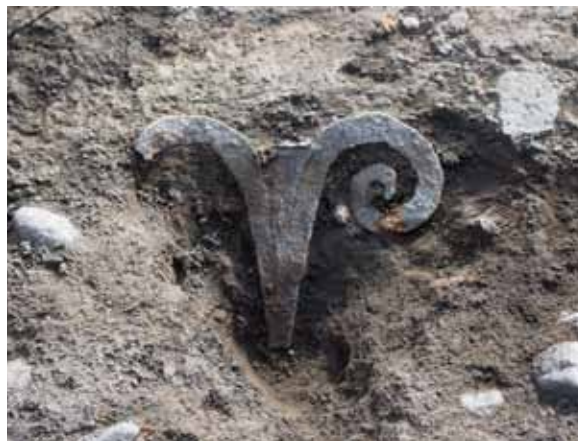
Ett av flera järnbeslag som prytt väggarna på den vendeltida hallbyggnaden på södra Kungsgårdsplatån i Gamla Uppsala.