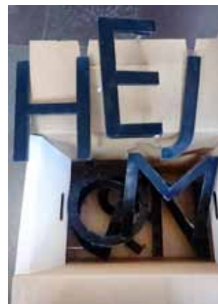
Flyttlasset går. Hejdå, gamla lokalen.

Ågatan fick golv och väggar rivs, vilket gav oss möjlighet att inreda efter egna önskemål. Det var väl värt den extra tid som gick innan vi kunde flytta in. Nu har vi en tillgänglighetsanpassad lokal med stort förråd, bibliotek/kontor, kök, snickarverkstad och inte minst – ett stort rum för kursverksamhet av olika slag. Läget är mycket centralt, med en bra innergård utanför fönstren. Under hösten besökte 1100 personer den nya lokalen under Kulturnatten, invigning, möten och kurser. En betydelsefull slöjdmötesplats och arena för Uppsala, dit olika föreningar redan känner sig som hemma för medlemsträffar, möten och andra aktiviteter.