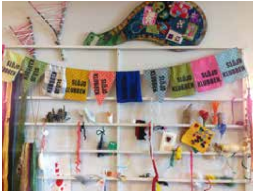
Ovan t.v.: Slöjdklubben – en inspirerande miljö för slöjdsugna barn. På Stenhagens bibliotek arbetar en utbildad handledare med öppen verksamhet för barn mellan 7 och 12 år.