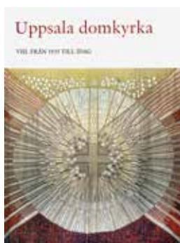
Det åttonde bandet i verket Uppsala domkyrka.