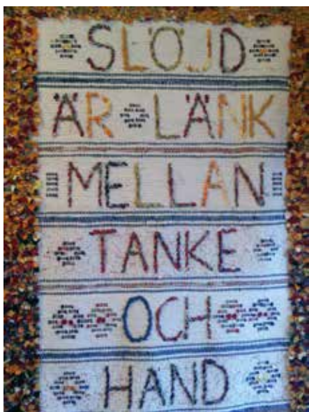
Slarvtjällställe, vävt av Barbro Andersson. Vävtagarna med olika teman samlar alltid många intresserade vävare.