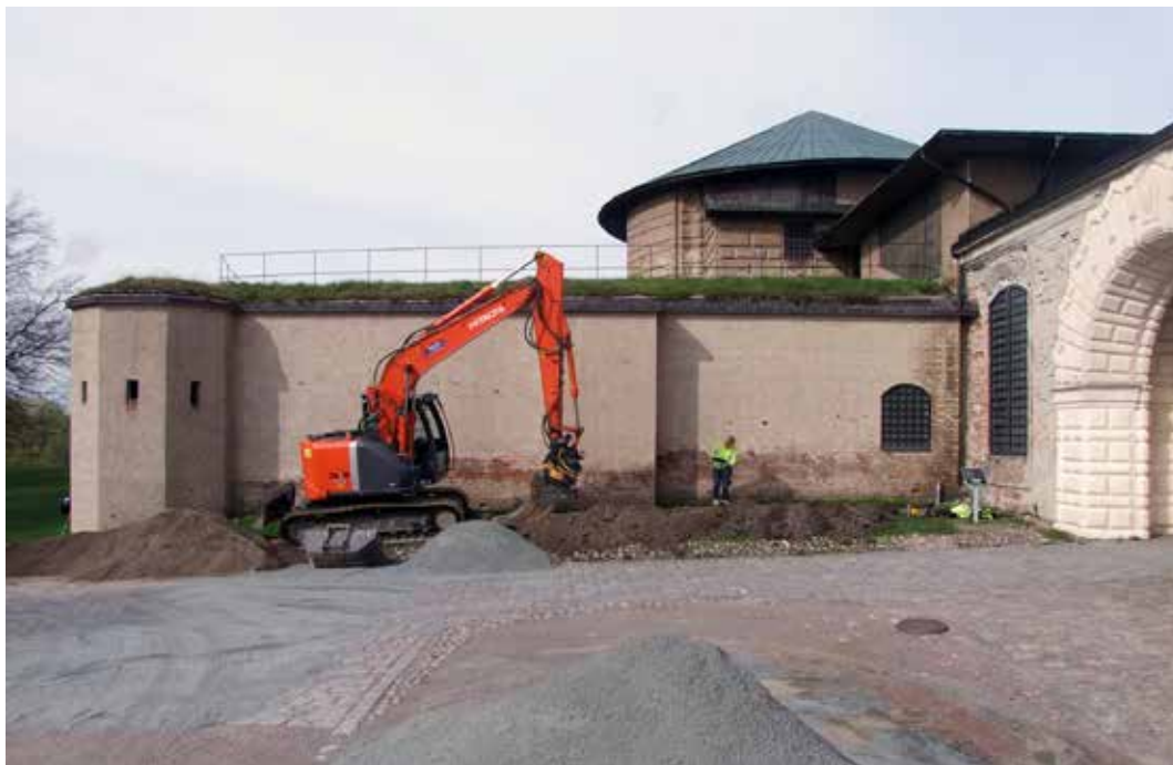
Vid bastion Gräsgården på Uppsala slott påträffades resterna efter bastionens gamla krutkammare i ett smalt schakt. Museets arkeologer var där och dokumenterade.

framkom strax innan årsskiftet tegeltaket till en tidigare okänd källare från 1500-talet. Intill universitetshuset och i universitetsparken genomfördes två mindre schaktövervakningar. Samma sak skedde intill Gustavianum . Slutligen blev det en mindre övervakning vid Akademiska sjukhuset intill det nyuppförda parkeringshuset i samband med trädplantering. Sammantaget för alla dessa schaktningsövervakningar i städerna blev att det arkeologiska resultatet överlag var magert. De flesta insatserna var tidsmässigt korta och berörde inte några längre sträckor. Oftast var tidigare rörnedläggningar gjorda på platserna, varför de nyupptagna schakten var störda av dessa nedgrävningar.