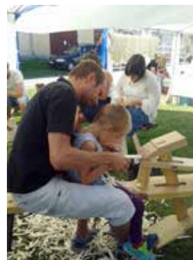
Täljning – en populär teknik för alla åldrar, bl.a. på slöjdvällar. Här en bild från Ullmarknadens prova-på-verkstad.

fick handledarna tillfälle att träffas, utbyta erfarenheter och diskutera sin roll.