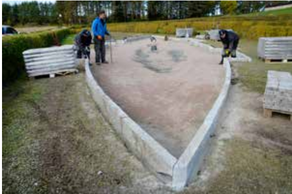
Ovan: Anläggande av askgravplats på Vendels kyrkogård.

Ovan t.h.: Flottarkojan på Färnäs i Dalälven uppfördes i slutet av 1800-talet. Den enkla byggnaden med kamin har tjänat som rastplats fram till flottningen i älven upphörde på 1970-talet och har nu genomgått en pietetsfull restaurering.