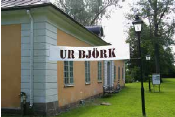
T.v.: Hur många föremål finns i en enda björk? De drygt 400 slöjdade föremålen visades under sommaren i Liljeforsateljén, Österbybruk.