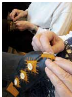
Broderi på cykelslang – traditionella tekniker möter nya material och användningsområden, här till ett armband. Från återbruksworkshop i Enköping.

Slöjdklubben är en rikstäckande fritidsverksamhet för barn 7–14 år som bygger på en genomtänkt pedagogisk idé. Här får barnen möjlighet att utforska och upptäcka hemslöjdens material och verktyg under ledning av slöjdhandledare som genomgått en utbildning på 64 lektioner som anordnas av hemslöjdskonsulenterna. Under året har fem slöjdklubbar varit igång i länet, fyra i Uppsala kommun och en i Östhammars kommun. Man träffas fem – åtta gånger per termin. Totalt har 249 barn deltagit i Slöjdklubbar under året. I samband med en träff