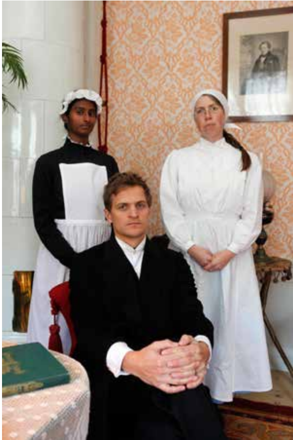
Under höstens kulturlov fick barn möjlighet att besöka professorshemmet i Walmstedska gården och möta professorn, husan och köksan.

spirationsdagen Låt kulturen ta tid som riktade sig till lärare. Arrangörer var den regionala barn- och ungdomskulturgruppen Kulturkraft. Museipedagoger och läns-hemslöjds-konsulenter ingår i gruppen som stod som arrangör för dagen. Föreläsningar varvades med kortare workshops för att ge lärarna olika exempel på pedagogiska metoder för konstnärligt arbete i skolan. Museipedagogerna höll en workshop om museipedagogik i utställningar, där lärarna fick genomföra några av värderingsövningarna från skolprogrammet till utställningen Det ligger i tiden . Hemslöjds-konsulenterna visade hur lärarna kan arbeta med slöjd via Youtube. Denna inspirationsdag ersatte i år den utbudsdag som Kulturkraft arrangerat tillsammans med Uppsala kommun tidigare år.