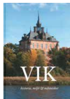
Omslaget till boken Vik – historia, miljö & människor.