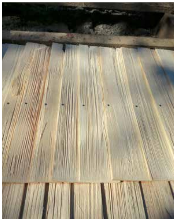
Vid omläggningen av taket på bastun valdes handspjälkade stickspån, som har betydligt bättre hållbarhet än de tidigare som var maskinhyvlade.

Byggnadsvårdsåtgärderna på Disagården har pågått för fullt under 2015. Det löpande underhållet har bland annat innefattat byte av trasiga takpannor, insättning av ny papp i hängrännor av trä samt omglasning och målning av fönsterbågar med spruckna glas. Det rötskadade plankgolvet i Gränbygårdens portlidel hade tidigare rivits bort. 30 cm av jorden grävdes nu bort med hjälp av en minigrävare och jordmassorna användes som utfyllnad framför fähuset och i slänten upp mot soldatorpet. På nio dubbla trädgårdsplattor anlades ett nytt luftigt golvbjälklag och på det spikades gamla begagnade golvplank. Soldatorpets väggar i farstun lerklinades. Gammal pappspik rensades bort från väggarna. Lerputs bereddades genom att blanda lera från tunnelbygget i Gamla Uppsala och kogödsel från Disagårdens ko med sand och hackad linhalm. Putsen stryktes på för hand av medarbetarna på Upplandsmuseets kulturmiljöavdelning och i samarbete med en kollega från Vallby friluftsmuseum i Västerås. I