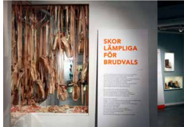
Skor lämpliga för brudvals – berättelsen om Nora Rydins brudskor.