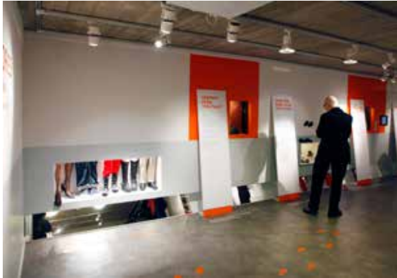
Utställningen Shoe Stories .