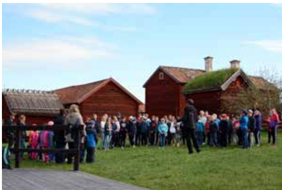
Ovan: Skuttunge och Björklinge skolor deltog i ett stort Skapande skola-projekt under våren. Här välkomnas hela Skuttunge skola till Disagården av museipedagog Vilhelm Sundbom.