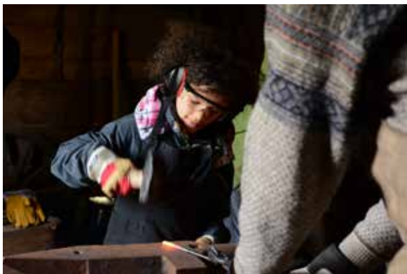
Disagårdens smedja är öppen under sommarens programdagar. Besökarna får hjälpa till att smida och dra pusten i smedjan.