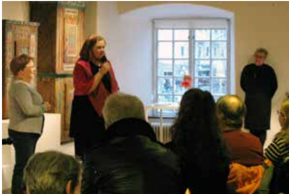
Överst t.v.: Museet fylldes av ungdomar vid invigningen av Pjux de luxe! En utställning gjord av gymnasieelever från Design -, konst- och arkitekturutbildningen på GUC.