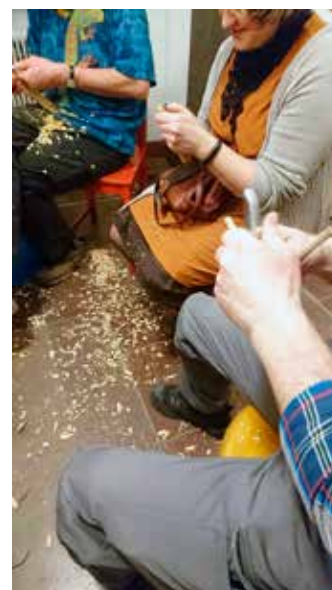
Slöjdvällar på Hemslöjden – en öppen verksamhet för alla. Besökarantalet har ökat markant under året och då särskilt verksamheten för unga vuxna.

natten har varit mycket välbesökt. Under året har hemslöjdskonsulenterna mött drygt 1100 personer i denna verksamhet på olika platser i länet. Utöver hemslöjdskonsulenternas verksamhet genomförde Hemslöjdsföreningen olika slöjdworkshops på Upplandsmuseet under utställningen Slöjd är livet .