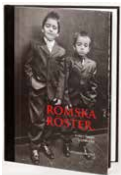
I anslutning till projektet Romska Röster producerade Upplandsmuseet boken Romska Röster.