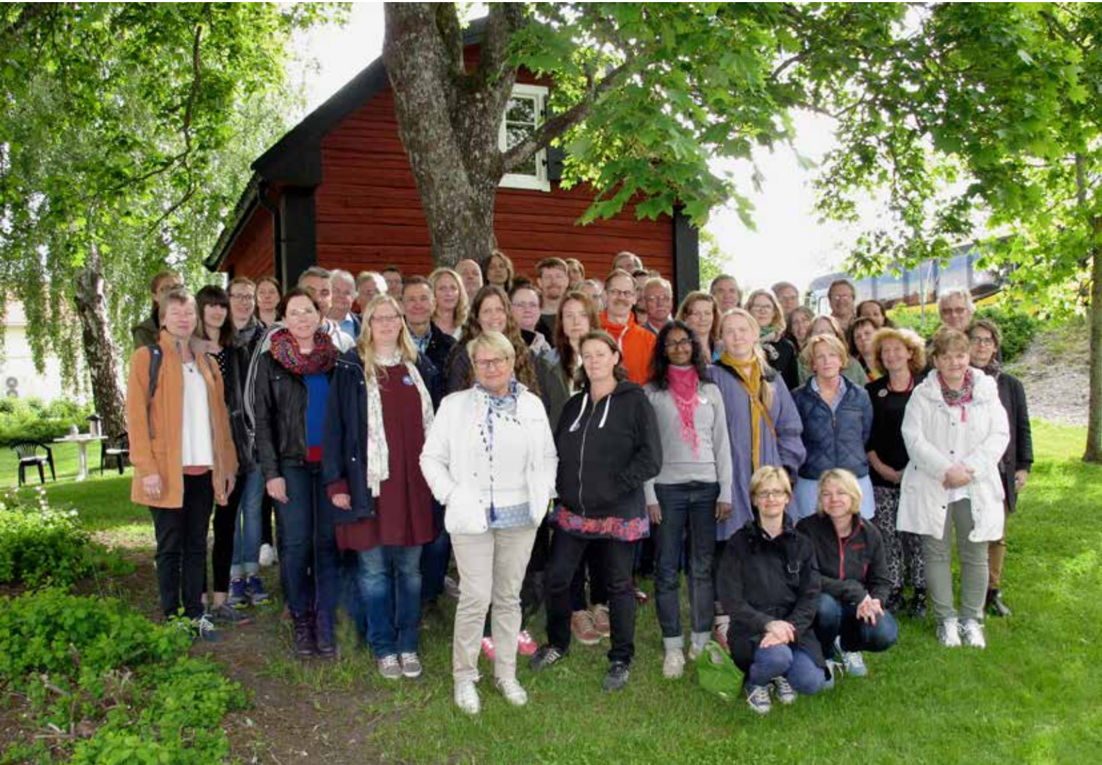
Upplandsmuseets personal på utflykt vid handelsmuseet Kappen, Örsundsbro.