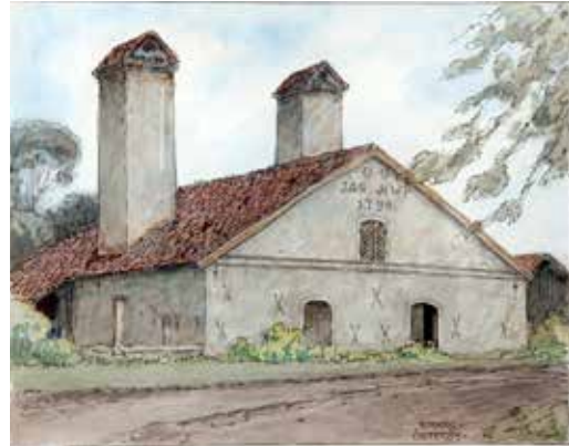
Smedjan i Österbybruk ingår i Upplandsmuseet samling av akvareller av arkitekten Ferdinand Boberg. Utställningen Uppländska bruk .

i olika tekniker och material illustrerade dagens slöjdproduktion. Under utställningstiden arrangerades slöjddemonstrationer, sommarslöjd för barn och ungdomar och föredrag. Utställningen som var producerad av Hemslöjdsförbundet i Uppsala län visades till den 16 augusti.