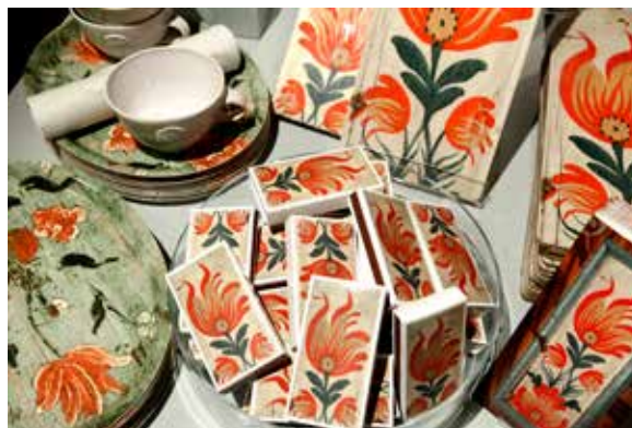
Dekormålade skåp med blommotiv, "flammande tulpaner" ur Upplandsmuseets samlingar, har gett inspiration till ett antal nya produkter i museibutiken. Det är unika produkter som endast säljs i museets butik.

Ett arbete med att se över butikssortimentet ur miljöaspekter har påbörjats och ska resultera i en miljöpolicy för sortimentet. Sortimentet av uppländsk litteratur utökades liksom allmän kulturhistoriskt inriktad litteratur. Böcker producerade av Upplandsmuseet och Upplands fornminnesförening och hembygdsförbund utgör en allt större del av utbudet. Inför varje större utställning förstärker butiken sortimentet med varor knutna till respektive tema.