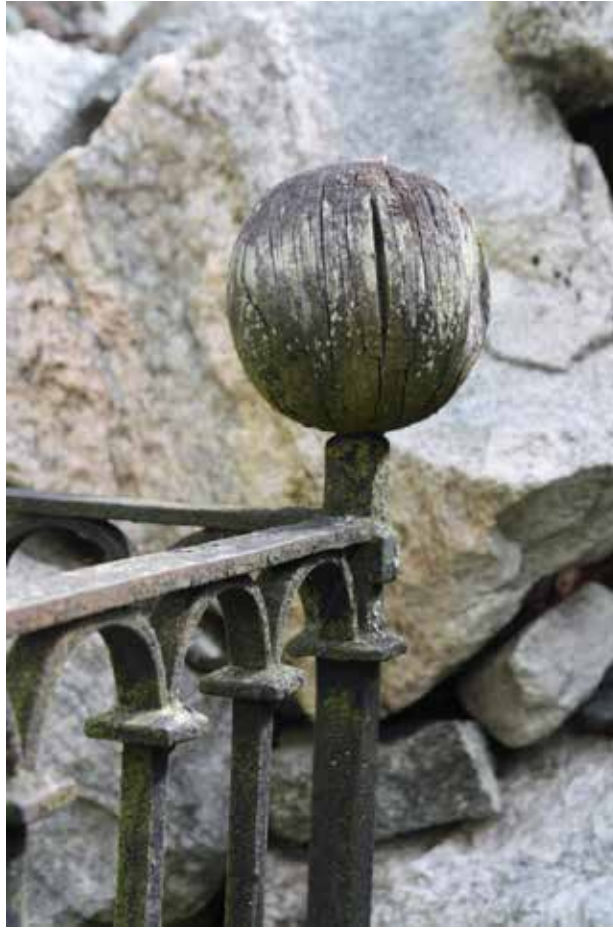
Torsvi kyrkogård är en av de kyrkogårdar i Enköpings pastorat som har inventerats under året. På kyrkogården finns bland annat några bevarade gravvårdar i trä från 1800-talets senare del, vilket är mycket ovanligt på länets kyrkogårdar. Detalj från gravplats, trärklott på smidesstaket.

Besöksmålen var i ordning Roskilde Vikingskipsmuseum, Roskilde domkirke, Vikingeborgen Trelleborg, Sagnland Lejre, Holbæk Museum, Moesgaard museum, Royal Jelling center, Øm klostertempel och ruinpark, Vikingemuseet Ladby och som avslutning Nationalmuseum i Köpenhamn. Många spännande museer besöktes, allt från det lilla stadsmuseet till det stora och internationellt anslående Moesgaard. Utöver detta var det mycket inspirerande att besöka Jelling centers nyöppnade museum.