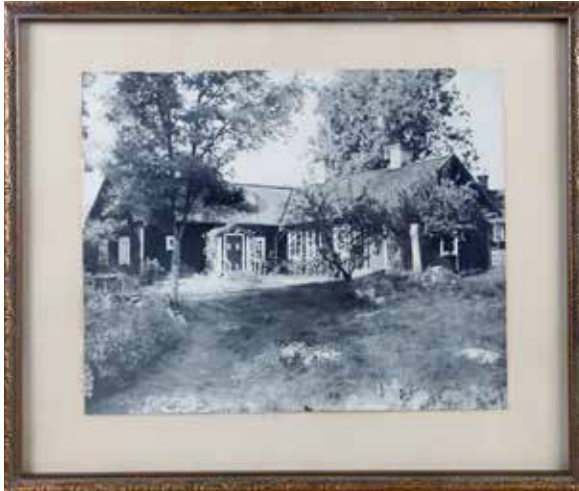
Ovan: UM43243. Inramat fotografi föreställande Forsmarks ålderdomshem.