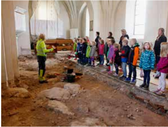
Ovan t.v.: Intresset för den arkeologiska undersökningen i Skuttunge kyrka var stort. I samarbete med museets pedagoger ordnades visningar för skolbarnen i Skuttunge skola.