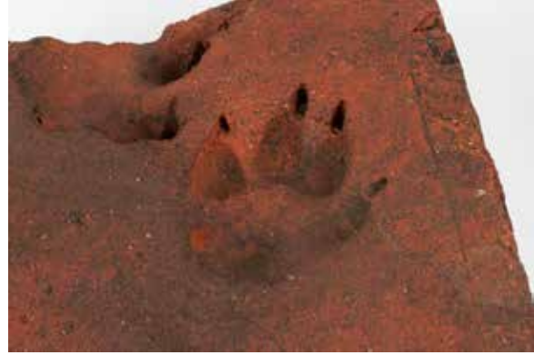
T.h.: Tegel med tassavtryck. "Kanske var hunden som lämnade sina spår i det nystrukna teglet så stor att tegelstrykaren inte vågade jaga bort den. Teglet lades i golvet på en av de många ugnar som försörjde Uppsalas tidigaste tegelbyggnader med tegel. En av de äldsta byggnaderna var Franciskanerkonventets kyrka som började byggas under 1200-talets mitt. Det var också de som till en början ägde tegelbruket som låg i det område där Akademiska sjukhuset precis har uppför ett nytt parkeringsgarage".

utgivare. 2015 års upplaga omfattade 164 sidor och totalt fem artiklar varav två skrivna av museets medarbetare, forskaren Pia Bengtsson Melin och kulturmiljöchef Per Lundgren. Redaktör för Uppland 2015 var landsantikvarie Håkan Liby.