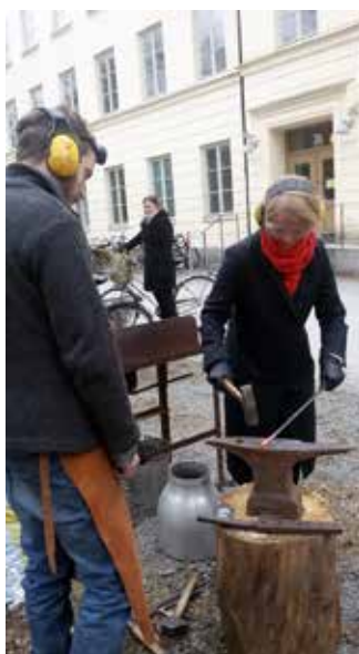
Teologidoktorander samlas runt stället för att smida spiken till sina avhandlingar.