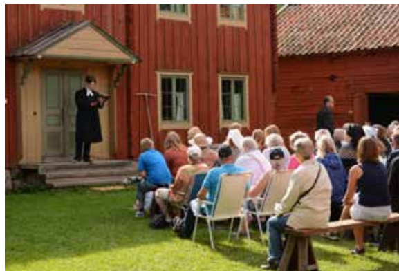
Norabella teatersällskap framförde en för Disagården specialskrivna föreställning, Från postilla till husmöte, om den uppländska väckelserörelsen.

Fastigheten Walmstedtska gården ägs av Uppsala kommun. Walmstedtska gården och främst bo-