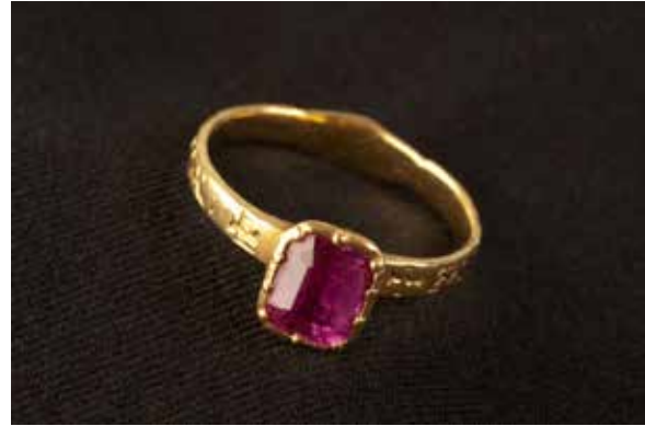
Senmedeltida ring med Mariainskrift ur Upplandsmuseets samlingar.

Elevutställningen PJUX de LUXE invigdes den 24 november inför en stor ungdomspublik. Utställningen var producerad i samarbete med gymnasieelever från Design-, Konst- och Arkitekturutbildningen på GUC som gav sin syn på temat skor. Med inspiration från Upplandsmuseets utställning Shoe Stories arbetade eleverna under höstterminen med att skapa skoskulpturer i keramik. 16 skulpturer ställdes ut på museet tillsammans med elevernas tankar kring skapandeprocessen.