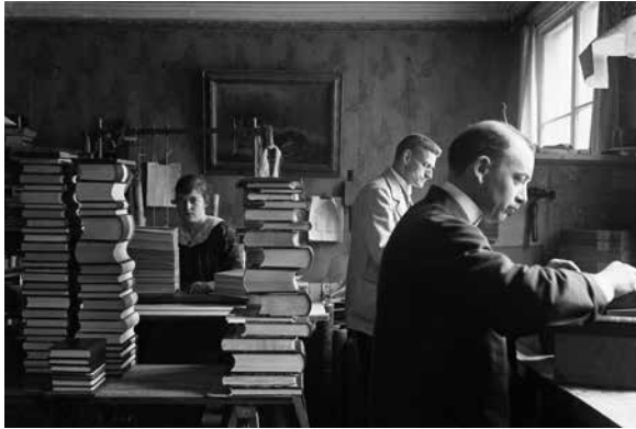
Arbete pågår i Bergmans Boktryckeri, Uppsala omkring år 1900.