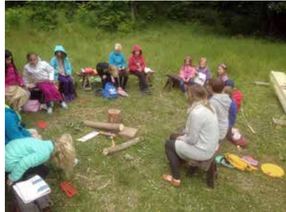
Slöjdläger på Disagården.