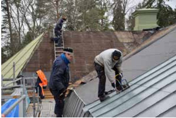
Omläggning av falsat plåttak på Eric Sahlström Institutet i Tobo, Tegelsmora, Tierps kommun.