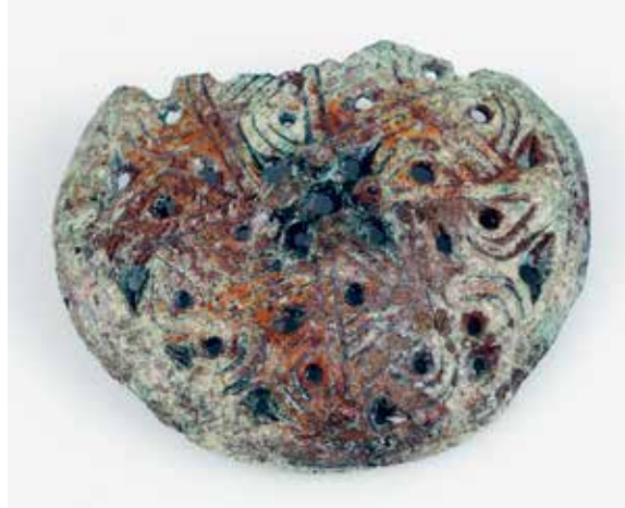
Rundspänne, UM43145, från yngre järnålder (datering 900-1000-tal). Spännet är tillverkat av brons och har genombruten dekor. Ornamentiken påminner om flätbandsornamentik. Spännet har haft en pigg och bär spår av förgyllning.

Förvärvkommitté tackade också ja till tre västar, UM43148–43150. Västarna, som är i ett mycket gott skick, visar en stilutveckling under 1800-talets andra hälft. Här finns även en intressant personhistoria. Västarna har använts och förvarats på en släktgård i Vallby, Danmarks socken. Gården bebos idag av givarna och har varit i släktens ägo i över 300 år. Här finns en tydlig anknytning till Upplandsmuseets profilområde jord.