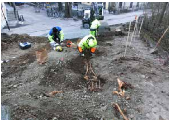
I slänten ner mot Ingmar Bergmansgatan framkom ett trettioåttal begravningar, där flera gravlagda låg långt ut och nära ytskiktet i slutningen.

arkeologisk schaktövervakning är Ingmar Bergmansgatan , Drottninggatan , S:t Persgatan och Trädgårdsgatan . Slutligen har det för Uppsalas del också skett övervakningar vid schaktningar utanför Uppsala slott och Ecclesiasticum . Till övervägande del är dessa övervakningar föranledda av arbeten med nedläggning av ledningar eller andra ingrepp i marken.