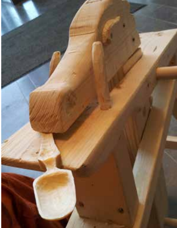
Intresset för hårdslöjd ökar.