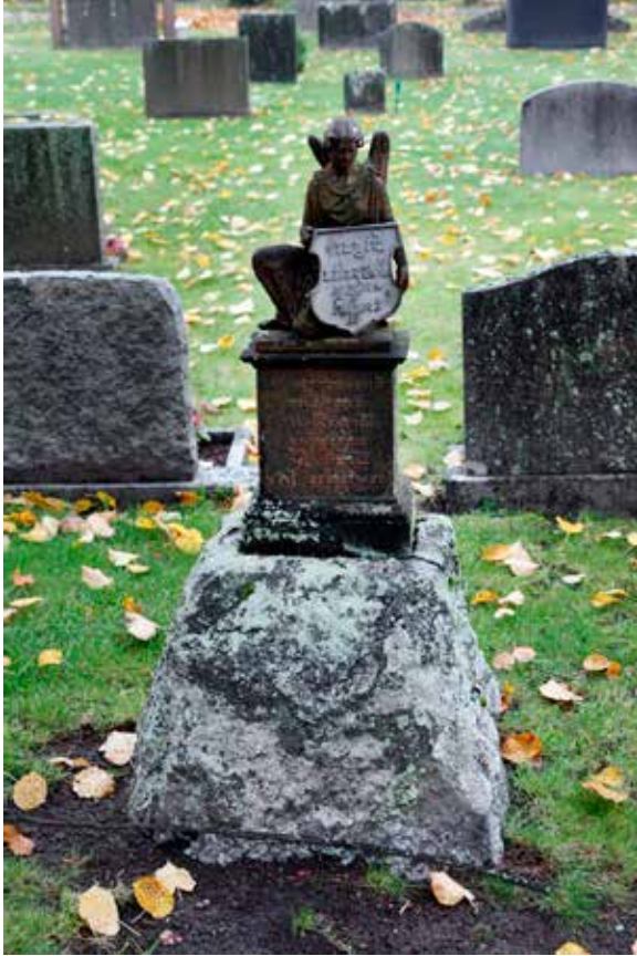
Gravvård vid Västerlövsta kyrkogård i form av en ängel som håller en skylt med den gravlagdes namn.