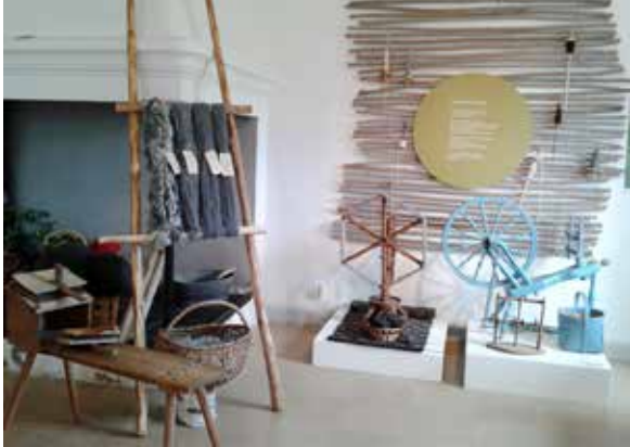
Från utställningen Hellylle- eller? Liljeforsateljén , Österbybruk.

Hemslöjden. Slöjdare/konsthantverkare bjöds in att komma och visa sin slöjd. Hemslöjdskonsulenterna dokumenterade och fotograferade. Bilderna visades i utställningen och många av alstren i utställningen var tillverkade av slöjdare som konsulenterna mött på Slöjdspaningar. Vid dessa tillfällen gavs också tillfälle att träffa andra slöjdare, diskutera material, prissättning och produktutveckling. De tre Slöjdspaningar som gjorts under året har haft ett fyrtiotal deltagare.