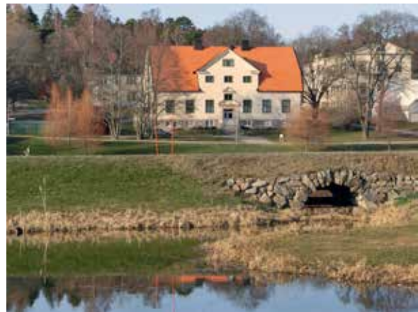
Det gamla Ultuna, med bland annat en särpräglad miljö med forsknings- och undervisningslokaler som hörde till Ultuna lantbruksinstitut, ingick i utredningsområdet Dag Hammarskjöldsstråket. I förgrunden syns en gammal stenvalvbro som uppfördes i början av 1800-talet, ett av områdets äldsta byggnadsverk som fortfarande är i bruk. Den tillkom då Ultuna fortfarande var en kungsladugård. Byggnaden i foden är Gamla hydrologen, uppförd 1912.