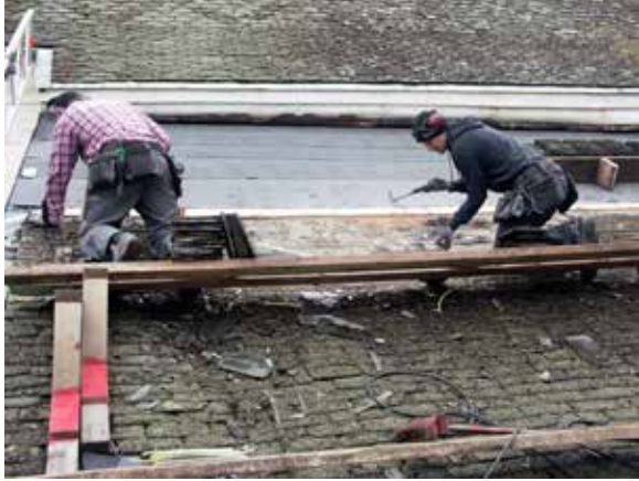
Demontering av den gamla skifferläggningen med Grythytteskiffer på Dalby kyrka.

ring av gamla brandstationen i Vattholma, (Uppsala kommun), åtgärder på dörr och fasader till Baptistkyrkan i Uppsala, restaurering av äldre bostadshus på Lövhagen, Järlåsa socken (Uppsala kommun), renovering av veranda på huvudbyggnaden på Härledgården, Torstuna socken (Enköpings kommun), renovering av timmerstomme och fönster i magasinsbyggnad på Fasma, Tensta socken (Uppsala kommun), lagning av takstol på lada på Lilla Järstena, Tillinge socken (Enköpings kommun), omläggning av tak på källargrund vid Tegelsmora prästgård (Tierps kommun), läggning av vasstak på trösklada på Älvkarleby hembygdsgård, Älvkarleby socken (Älvkarleby kommun), restaurering av lövsågerier och balkong på huvudbyggnaden på Göksbo gård, Altuna socken (Enköpings kommun), åtgärder på putsfasad och snickerier på byggnadsminnet Veckholms gamla prästgård, (Enköpings kommun), fönsterrenovering på brygg- och bagarstuga och ladugård inom byggnadsminnet Lövestabruk, (Tierps kommun), omläggning av tak på f.d. smedsbostad inom byggnadsminnet Lövestabruk, (Tierps kommun), omläggning av falsat plåttak, snickeri- och putsarbeten på Eric Sahlström-institutet i Tobo, (Tierps kommun), kompletteringsplantering av träd och buskar i Engelska parken inom byggnadsminnet Örbyhus slott, Vendels socken (Tierps kommun), åtgärder på visthusbod och