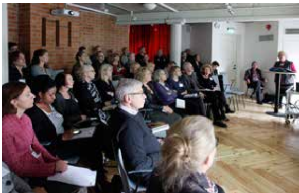
Konferensen Museernas forskning en växande resurs resulterade i bildandet av ett nordiskt forskningsnätverk som administreras av Upplandsmuseet.