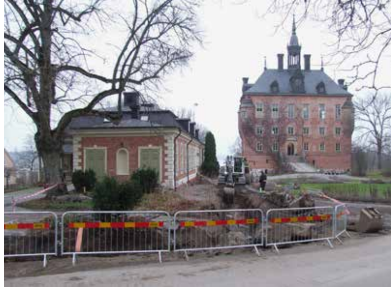
Arkeologisk övervakning vid Viks slott. Här påträffades spår efter bebyggelse från 1300-talet.

fanns spår efter olika slags händelser eller verksamheter intill runstenen? Runstenens läge enligt äldre kartmaterial i ängsmark invid Knivstaån, kan i första hand ses som att den varit placerad intill en väg med tillhörande vadplats.