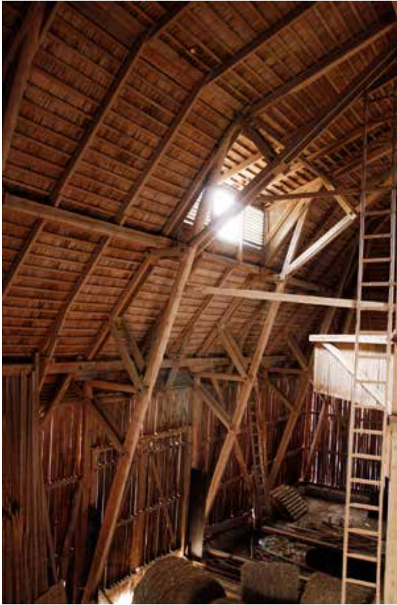
Lilla Järstena. Lada från 1930-talet med en ståtlig takstolskonstruktion som bär det valmade, högresta tegeltaket. Takstolen reparerades 2014 med byte av en drygt 11 meter lång snedsträva.

och takkupor på Slottet inom byggnadsminnet Viks slott (Uppsala kommun), Omläggning av tak på bostadshus inom byggnadsminnet Härnevi kvarn och såg (Enköpings kommun) samt om- och nybyggnad av Ekonomigården på Uppsala gamla kyrkogård.