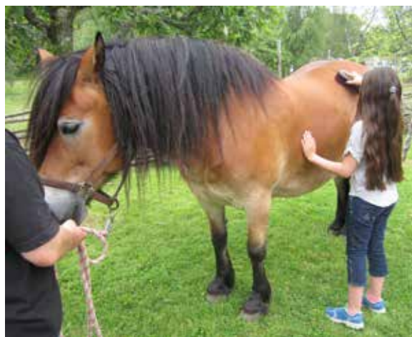
Att rykta en häst var en av många arbetsuppgifter som barnen kunde prova på under programdagen Leka för att lära.