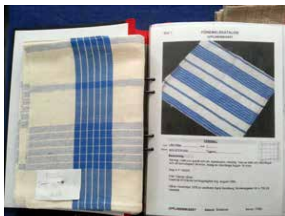
Alunda vävstuga har arbetat med gamla förlagor från Upplandsmuseet.

Hemslöjdskonsulenterna tog under hösten initiativ till ett möte med Hemslöjdsförbundet, Uppsala hemslöjdsförening, Brukssmederna, Östhammars hemslöjdsförening, studieförbunden och Föreningen Upplandslin för att ge tillfälle att presentera respektive verksamhet, vad som är på gång och möjliggöra samarbeten mellan de olika aktörer i länet som har slöjd på agendan.