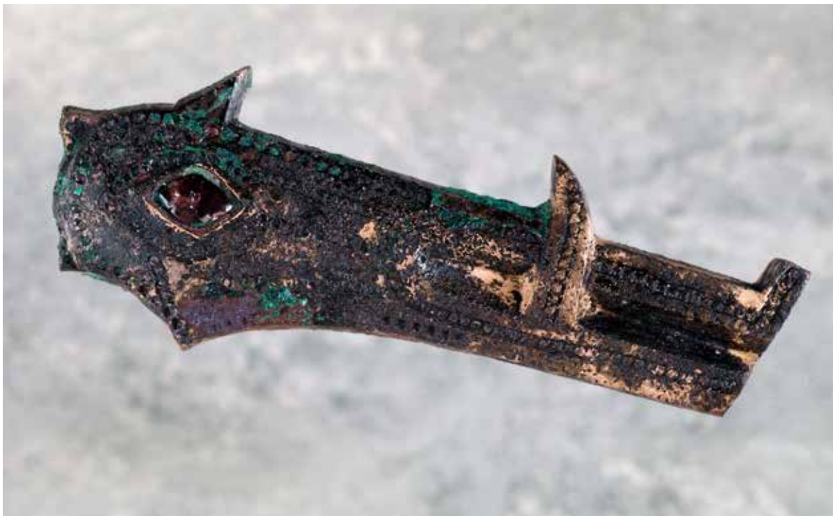
Åter från konserveringen framträder ett av de mer ovanliga fynden från Gnistaundersökningen, som sannolikt suttit på en sköld, ett grishuvud, förgyllt med öga av röd granat.

Tyngdpunkten på 2014 års arkeologiska undersökningar kom att ligga jämnt fördelad mellan insatser i stad, på landsbygd och i kyrkomiljöer. Övervägande del av dessa undersökningar hade karaktären av schaktningsövervakningar, där uppdraget i fält kunde variera från några timmar upp till flera veckor.