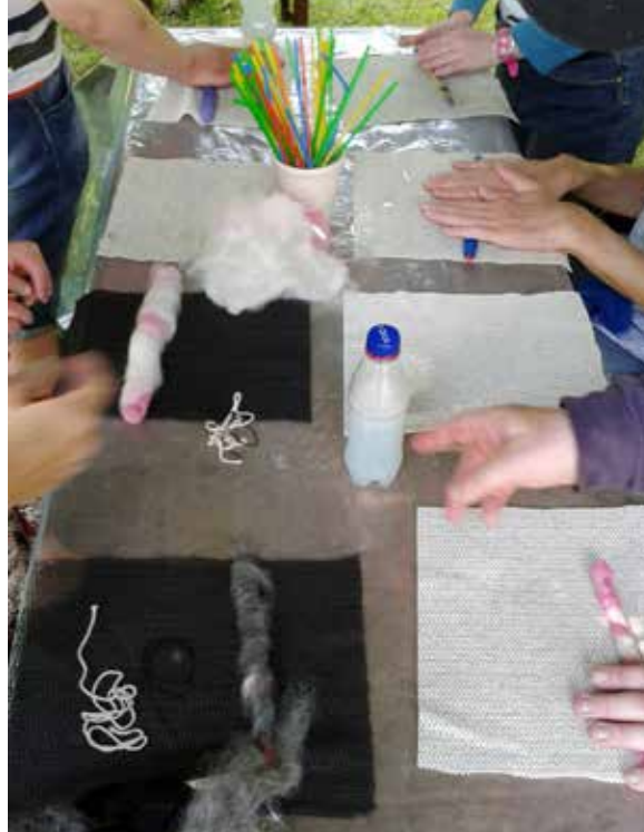
Workshop i tovning, Österbybruk.

Som ett komplement till de långa kurserna arrangeras även prova-på-tillfällen för att locka in och väcka nyfikenhet och intresse för slöjden och för de mer avancerade kurserna. Totalt 65 workshops och prova-på-tillfällen har arrangerats på olika platser i länet med ett deltagarantal på 931 vuxna och 393 barn.