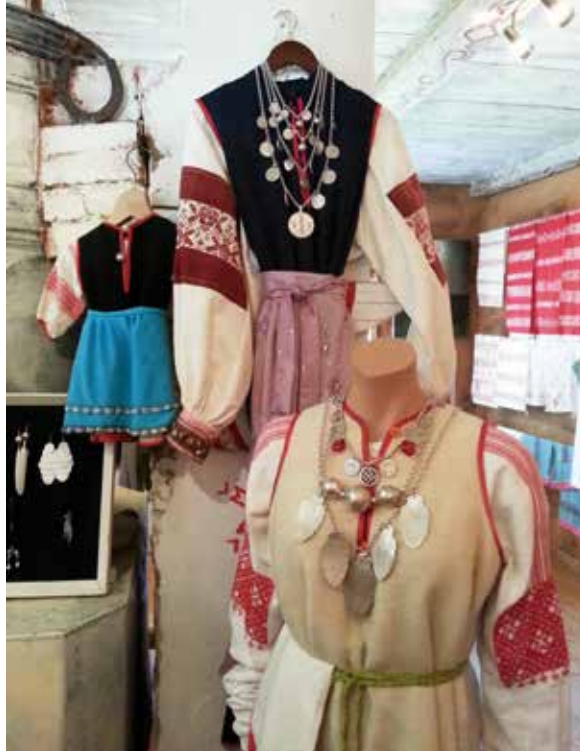
Dräkter från Setomaa, sydöstra Estland.

Hemslöjdskonsulenterna har deltagit i P4 Radio Uppland vid tre tillfällen och i längre inslag berättat om bl.a. Från lamm till tröja . UNT:s sida ”På