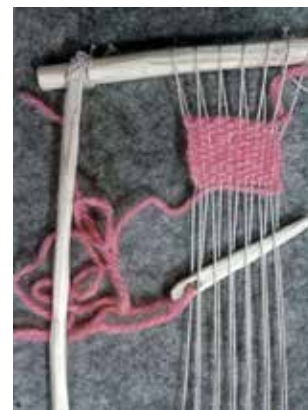
Vävram, Kulturnatten.

Nämnden för hemslöjdsfrågor har ett strategiskt samordningsansvar och är pådrivande och stödjande inom hemslöjdsområdet samt bidrar med omvärldsanalys, information, utbildning och kontakter som ger möjlighet till utveckling och gränsöverskridande samarbeten med andra kultur- och politikområden samt civilsamhället. Hemslöjds-konsulenterna deltar vid fortbildningsveckor två gånger per år.