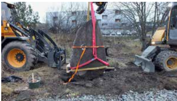
Vid Ängby, Knivsta flyttades en runsten inför kommande iordningsställande av järnvägsområdet.