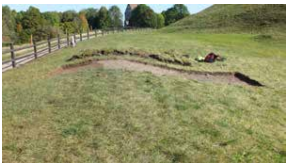
Väster om västhögen i Gamla Uppsala grävdes ett mindre schakt genom en vallformation.

– framväxten av ett mytiskt centrum”, där Upplandsmuseet är en samarbetspartner, fortsatte med en mindre undersökning. I år genomfördes undersökningar av en förmodad vallanläggning i västra delen av Högåsen samt av tidigare genom magnetometer indikerade rader med stolpfundament längs med östra sidan om denna.