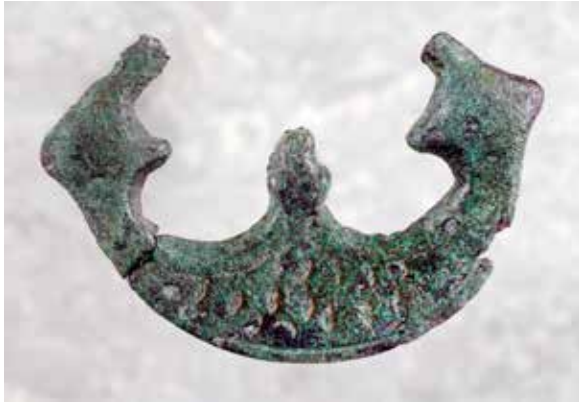
Hänge från skadad gravhög, Gamla Uppsala. Vikingatid 800-850 e. Kr.