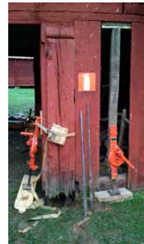
Gränbygårdens portlider höjdes för att inte syllstockarna skulle ligga under jord, en grannlags uppgift som krävde stor försiktighet.

Frluftsmuseet och byggnadsminnet Kvekgården i Stora Kveks by utanför Örsundsbro ägs av Upplands fornminnesförening och hembygdsförbund. Upplandsmuseet ansvarar för byggnadsvården på Kvekgården på uppdrag av ägaren. Under året har mindre underhåll utförts, som tillverkning av nya grindar.