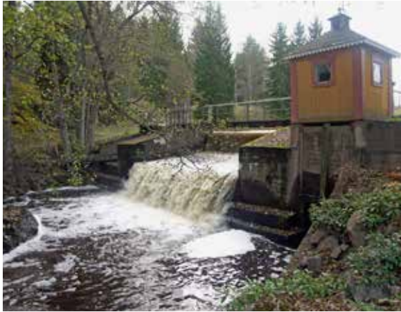
Dammvallen och fallet i Jumkilsån vid Ullbolsta utgör ett vandringshinder för fisk, men är också en miljö med kulturmiljövärden.