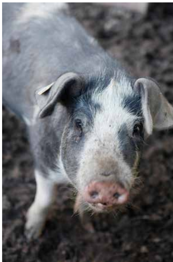
Årets nytillskott bland djuren på Disagården, Linderödssvinet ”Bläckis”.