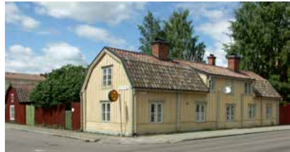
Exempel på bygglovavärende i kvarteret Mältaren i Enköping.