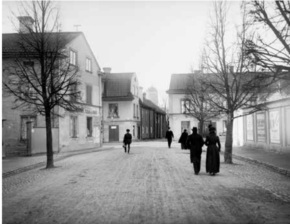
Bangårdsgatan 1902, foto Alfred Dahlgren, visades i utställningen Människan och staden. Upplandsmuseets bildarkiv.

kor och miljöer, erhöll uppdrag, fick beställningar, såg förändringar, förevigade märkvärdigheter och fångade ögonblick.