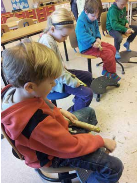
Förskolebarn på Storvetaskolan, "Tälj en älg".