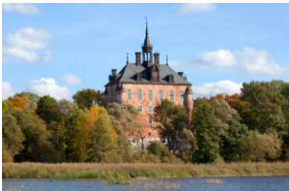
Viks slott. Fotograf Olle Norling svarar för huvudparten av bildmaterialet i den kommande boken om Vik.