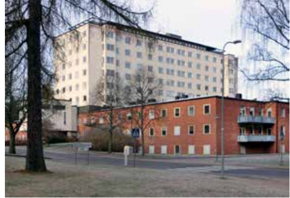
Den stora centralbyggnaden på Ulleråkers sjukhus, med lågdel i rött tegel och vitputsad högdel, uppfördes 1965 efter ritningar av Sture Frölen. Byggnaden har ett stort medicin- och arkitekturhistoriskt intresse och utgör ett landmärke i området.