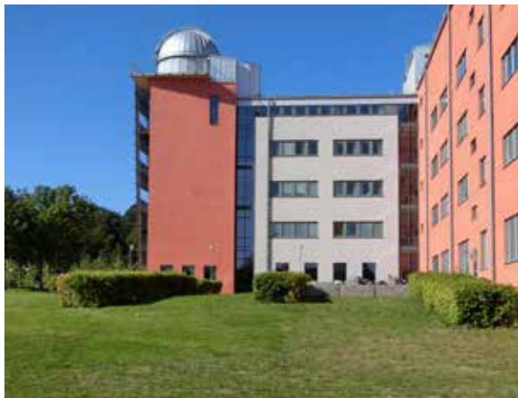
Ångströmlaboratoriet, som angränsar till byggnadsminnet Polacksbackens kasernetablissemang. Byggnaden uppfördes i början av 1990-talet efter en arkitekttävling som vanns av Tema arkitekter. I samband med en planerad utbyggnad utredde Upplandsmuseet konsekvenserna för områdets kulturhistoriska värden.