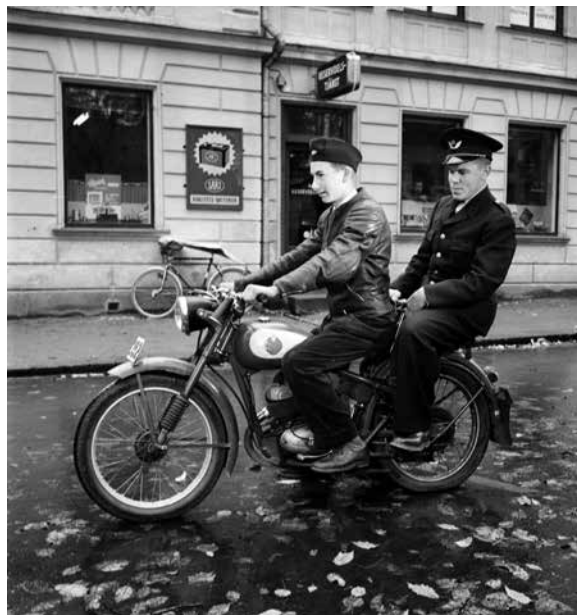
Motorcykel med dubbelkommando, Söderströms bilskola i Uppsala, sannolikt 1950-tal.