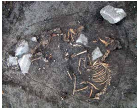
Vid slutundersökningen i Slavsta påträffades lämningar efter djuroffer. I ett fall hade man lagt ned flera djur i samma grop. Ett av djuren, ett får, är i det närmaste intakt.

Upplandsmuseet har under 2014 arbetat med en kulturhistorisk inventering av gravplatser på kyrkogårdar inom det västra kontraktet i Uppsala stift, ett projekt som inleddes 2013. Med arbetet i fält dokumenteras alla gravvårdar uppförda före 1980 med text och bild. Det sammanställs tillsammans med arkivundersökningar i en rapport för varje kyrkogård. Kunskapen utgör sedan grund för en kultur-