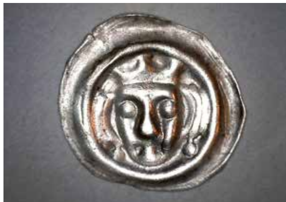
Det arkeologiska arbetet i Enåkers kyrka avslutades under 2014. Vid undersökningen påträffades ett flertal mynt. Här ses en silverbrakteat präglad efter 1410, under Erik av Pommerns regeringstid.

Den andra platsen som överraskade var en schaktövervakning inför anläggande av en ny trappa vid Ingmar Bergmansgatan upp mot Helga Trefaldighetskyrkan. I slänten ner mot gatan påträffades delar av den tidiga kyrkogården. Inom en mindre yta återfanns förutom lösa benrester, även begravningar efter ett trettital individer.