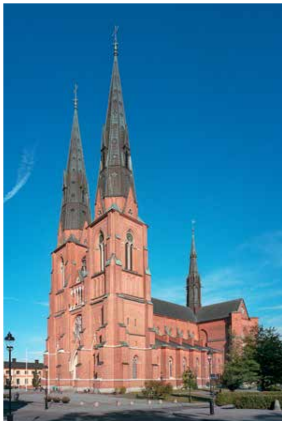
Uppsala domkyrka från sydväst. Illustration i Uppsala domkyrka, volym VII. Foto Olle Norling.

Bondsagan och Sigvard Cederroths upppteckningar. På uppdrag av Kungliga Gustav Adolfsakademien för folklig kultur har Upplandsmuseet under året avslutat arbetet med folklivsupptecknaren Sigvard Cederroths efterlämnade material. Det rika upppteckningsmaterialet avhandlar arbete, kosthåll, seder, märkesdagar och folkstro under sent 1800-tal i socknarna nordöst om Uppsala och har nu publicerats i en diger volym i Akademiens serie, Acta Academiae Regiae Gustavi Adolphi nr 129. Upppteckningarna är publicerade encyklopediskt och de 10 000 posterna är även registrerade i museets databas Primus samtidigt som de finns tillgängliga på nätet via Digitalt museum genom ett omfattande arbete av Barbro Björnemalm.