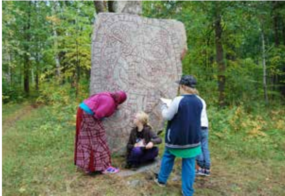
Elever från Hammarskolan i Gimo undersöker en runsten i skolans närområde i samband med det pedagogiska programmet Portal till vår forntid.