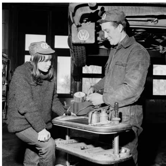
"Flicka prygar på Perssons bil i Tierp" – reportage i Arbetarbladet 1968.