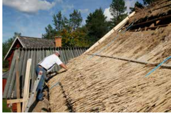
Vasstakläggning på tröskladan, Älvkarleby hembygdsgård, Gammalgården.

Vårdplaner. På uppdrag av länsstyrelsen har Upp-