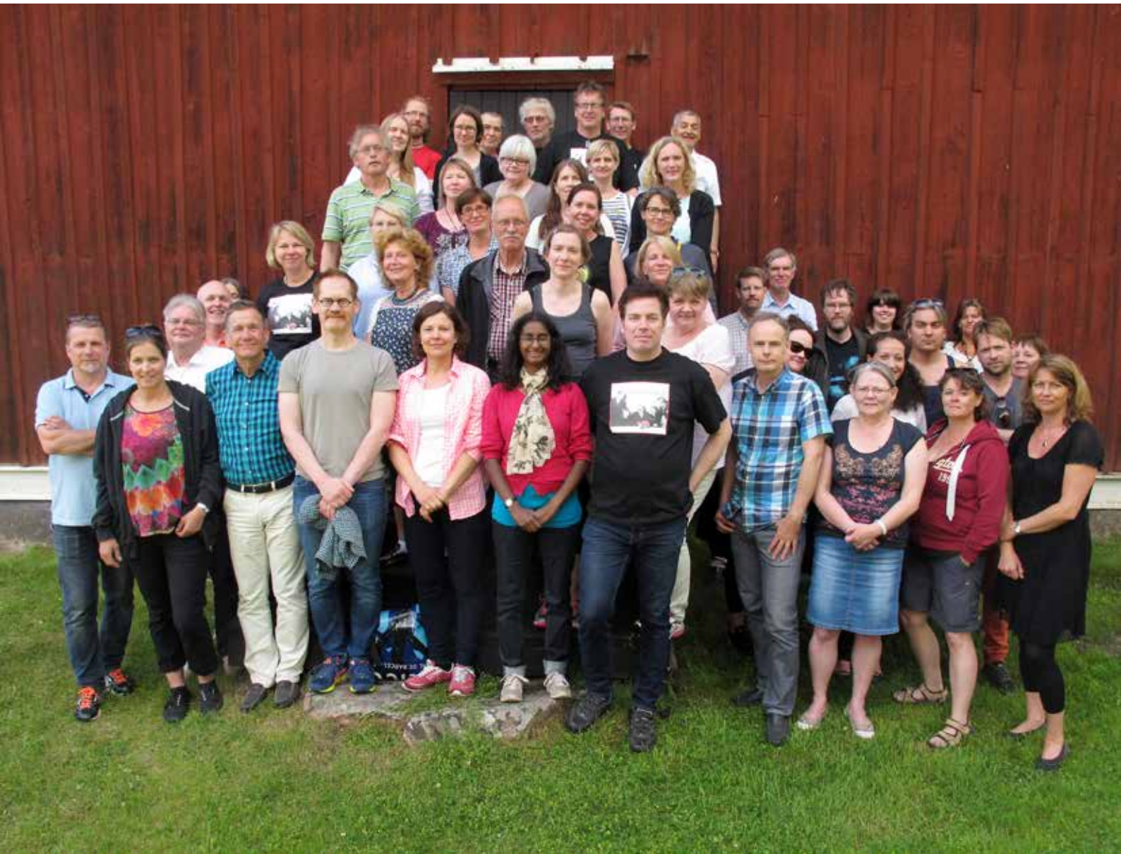
Upplandsmuseets personal på utflykt i Älvkarleby.