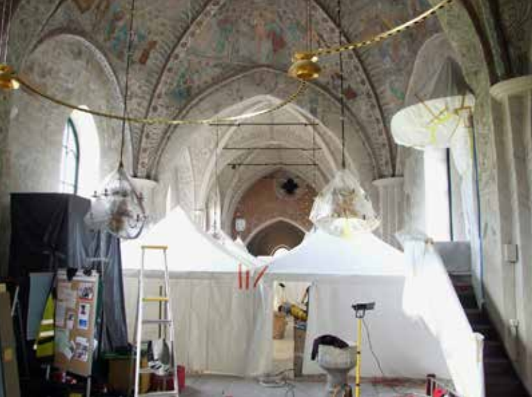
Arkeologisk övervakning i samband med golvbyte i Danmarks kyrka.