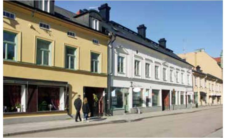
Gatuhuset Svartbäcksgatan 26–30 i kvarteret Lindormen i Uppsala.

åtgärder. För vart och ett av delområdena har riktlinjer för framtida användning tagits fram, liksom för utredningsområdets möte med omlandet. Arbetet har utförts på uppdrag av Uppsala kommun.