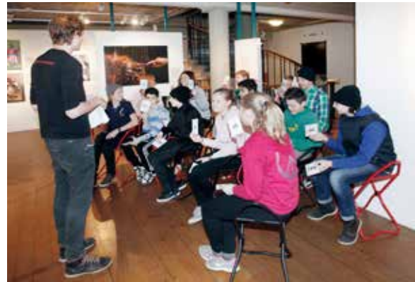
Elever från åk 7 i Björkvallsskolan genomför en värderingsövning på temat hållbar utveckling tillsammans med museipedagog Vilhelm Sundbom i utställningen Vår tid på jorden.

giska institutet och händelser i Uppsala under andra världskriget visades under 2012–13. Det pedagogiska programmet efterfrågas fortfarande av lärare och har nu omarbetats till en klassrumworkshop. Den riktar sig till elever i åk 9 och gymnasiet och tar upp frågeställningar som mänskliga rättigheter, solidaritet samt åsikts- och yttrandefrihet. Utgångspunkten har varit skeenden i Uppsala före och under andra världskriget, men kopplingar görs också till nazistiska och främlingsfientliga strömningar idag.