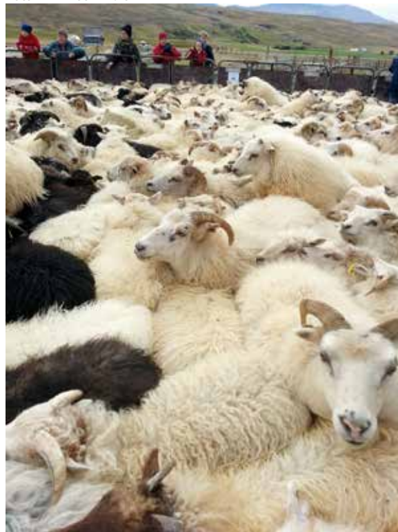
Nedan: Fåren samlas in efter sommaren. Blönduos, Island.