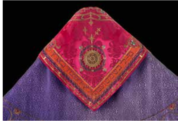
Detalj av Nathan Söderbloms ärkebiskopskåpa. Huseliusprojektet.

informationsfrågor. Föreningen har som vanligt producerat foldern Uppsalas museer med svensk och engelsk information. UMI har gemensamt arrangerat Museidagen på Fars dag den 9 november.