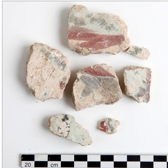
Figur 13 (t.v.). Urval från de bemålade kalkputsfragmenten, F1, med schablonmotiv i rött, blått och svart.