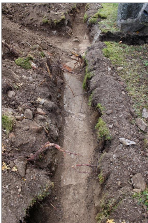
Figur 5. Stenblocken B tolkas som resterna av en grundmur till den medeltida kyrkan i Ramsta. Intill och mellan stenarna fanns kalkbruk. Foto mot Ö.

B. Grundmur. Strax väster om raseringslagret A påträffades i schaktet två stora, rektangulära, stenblock (figur 4 och 5). Stenarna var ca 0,8 m stora och låg ca 0,4 m under mark. Intill stenarna fanns kalkbrukskross och mellan dem fanns fastsittande kalkbruk kvar. Sannolikt utgör stenarna rester av en äldre grundmur, möjligen till den medeltida kyrkan. Ringledaren kunde placeras ovan stenblocken och de lämnades kvar på plats.