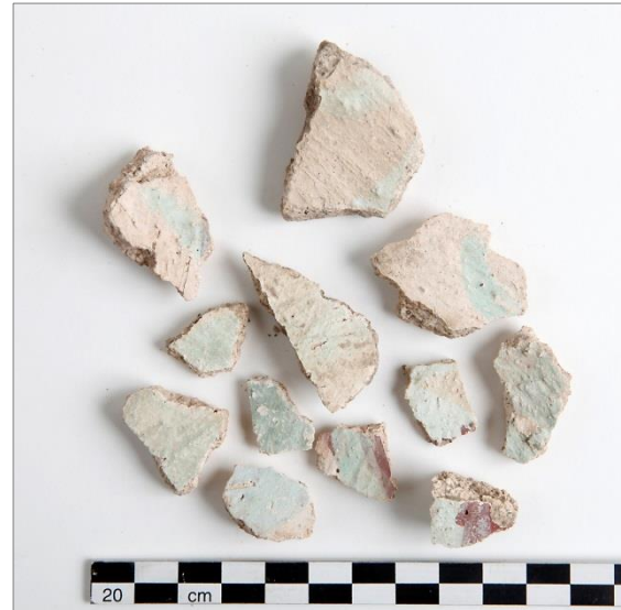
Figur 14 (t.h.). Urval från de bemålade kalkputsfragmenten, F1, med ljus blå färg.