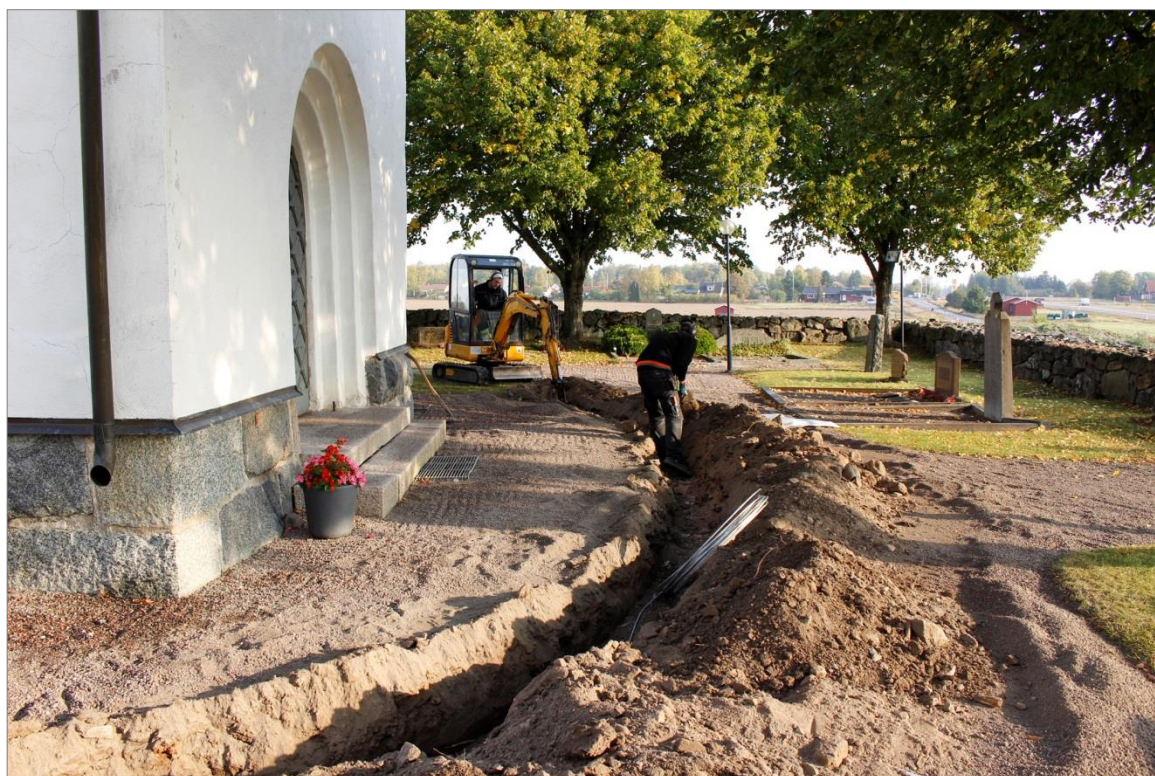
Figur 3. Pågående schaktningsarbeten vid Ramsta kyrkas östtorn. Foto mot S.

Det arkeologiska arbetet omfattade övervakning av schaktsträckan runt om kyrkobyggnaden. Dokumentationen gjordes genom planritning, beskrivningar samt foton. Fältarbetet genomfördes 2016-09-26 – 2016-09-27. Markarbetet utfördes med en liten grävmaskin. Schaktbredden var 0,3-1,2 m och djupet 0,3-0,5 m.