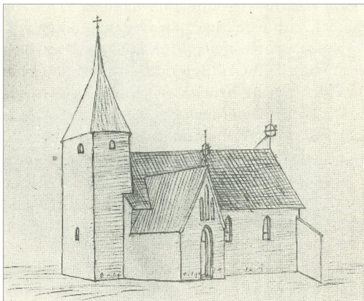
Figur 2. Den medeltida kyrkan i Ramsta avbildad av Peringskiöld i slutet av 1600-talet.

Den medeltida kyrkan utdömdes och revs på 1840-talet och ersattes av en ny vilken invigdes 1846. Den nya kyrkan var en typisk representant för Karl Johantidens arkitektur uppförd med ett stort rektangulärt långhus med sakristia i öster samt ett västtorn. Såväl interiör som exteriör var utförd i ett klassicerande formspråk. Efter en brand revs kyrkan år 1914 och ersattes senare med den nuvarande kyrkobyggnaden (Blent 1997).