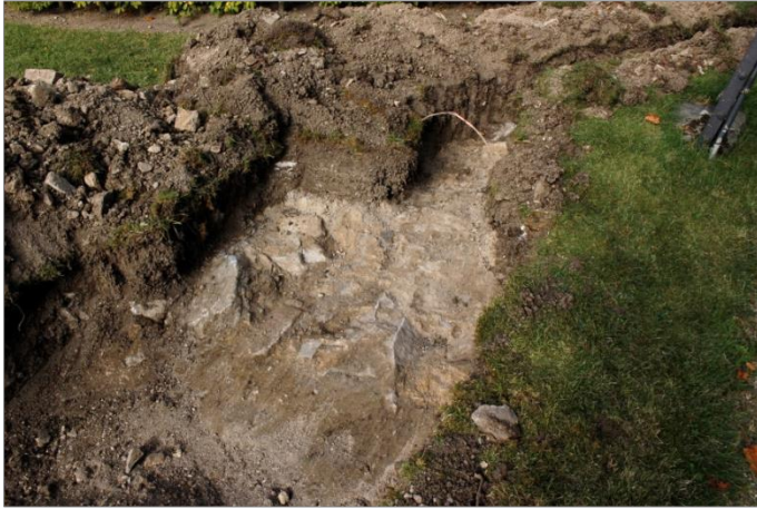
Figur 6. I schaktet längs kyrkobyggnadens västgavel påträffades delar av en grundmur (C) bestående av gråsten sammanfogade med kalkbruk. Muren var väl avgränsad i norr och söder. Foto mot N-NV.