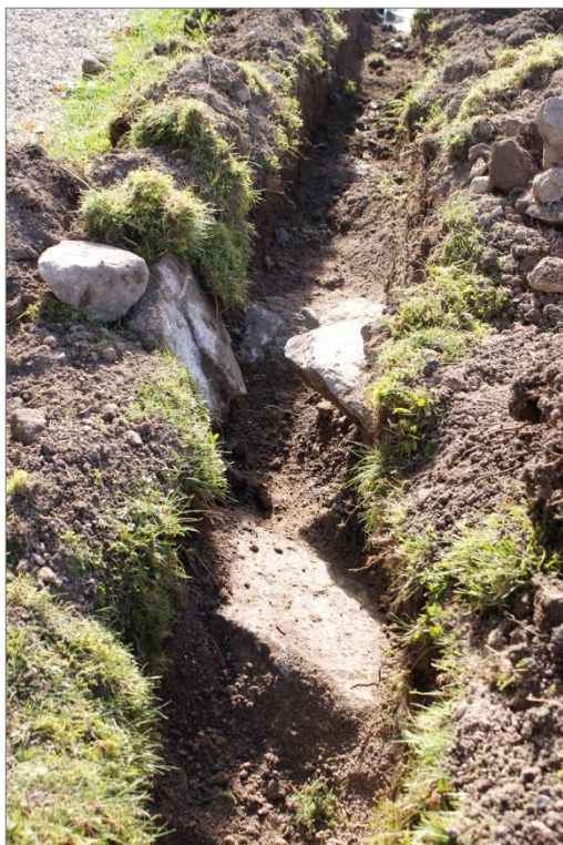
Figur 10. Murrest D var ca 1,2 m bred och bestod av gråsten med rester av kalkbruk. Foto mot S.