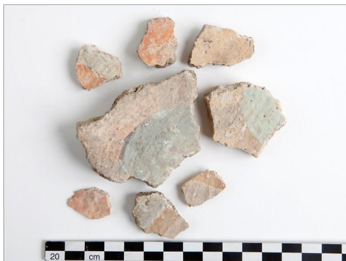
Figur 15. Urval från de bemålade kalkputsfragmenten, F1, sannolikt delar av figurala motiv.