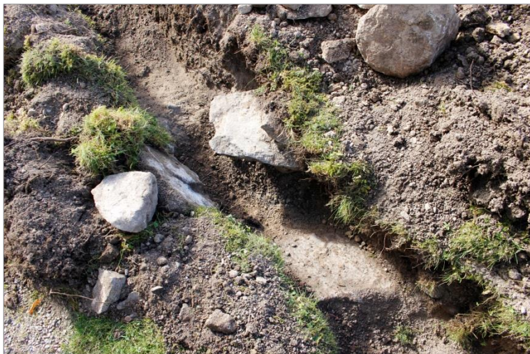
Figur 9. Tre meter söder om grundmuren C påträffades resterna av ytterligare en mur (D). Vissa av stenarna i muren låg väldigt löst och grävdes av misstag upp.

Längs kyrkobyggnadens västgavel, ca tre meter söder om grundmur C, påträffades i schaktet resterna av ytterligare en mur. Denna bestod av delvis löst liggande gråstenar med rester av kalkbruk. Då vissa av stenarna låg löst direkt under matjorden grävdes dessa bort av misstag av grävmaskinisten. Dock uppmärksammades detta och delar av muren kunde rensas fram för hand och dokumenteras in situ. Stenarna var ca 0,15-0,4 m stora och murresten var 1,2 m bred. Muren var inte lika rejäl som grundmur C och det fanns inte heller lika rikligt med kalkbruk. Möjligen utgör murrest D delvis raserade delar av en mur och hör sannolikt samman med grundmur C.