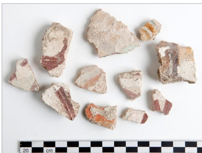
Figur 16. Urval av de bemålade kalkputsfragmenten, F2, med spår av överkalkning.