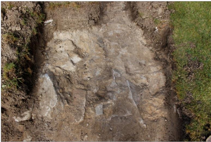
Figur 7. Mur C var ca 2 m bred och tolkas vara rester av grundmuren till den medeltida kyrkans västtorn. Foto mot N.