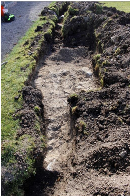
Figur 8. Grundmuren C rensades fram för hand. Ringledaren kunde placeras ovan denna men jordplåten lades strax söder om muren. Foto mot S.